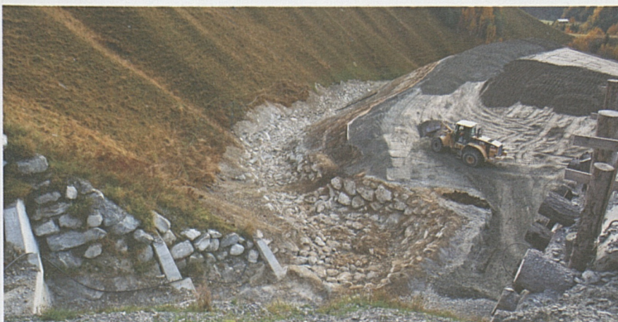
Bachbett Drun da Bugnei im oberen Bereich. Rechts die Deponie Val da Bugnei Ost.

Im Jahre 2006 erfuhr das ursprüngliche Projekt eine Anpassung, nachdem wegen des Baufortschrittes in Sedrun und in Faido eine Verlängerung des Tunnelbauloses vorbereitet und die Deponie im Val Bugnei vergrößert werden musste. Diese Projektänderung erforderte, dass ein Teil des bereits gebauten unteren Bachlaufes aufgehoben und verlegt werden musste. Dies ermöglichte, dass der untere Teil des Bachlaufes auf der ganzen Länge fischgängig wurde. Wie die Fische den neuen Bachlauf annehmen, wird sich in den nächsten Jahren zeigen. Man darf gespannt sein, wie sich die Tiere im neuen Bach zu Hause fühlen.