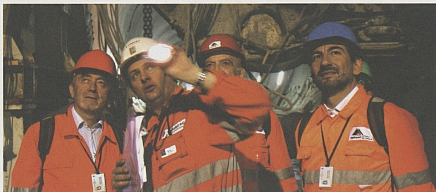
Foto sopra: l'Assessore Cattaneo (con il casco blu) ascolta con attenzione le spiegazioni tecniche.

Nel pomeriggio, l'Assessore alle infrastrutture e alla mobilità della Regione Lombardia, Dr. Raffaele Cattaneo, su invito del Consigliere di Stato Marco Borradori, ha voluto toccare personalmente con mano i lavori di AlpTransit, facendo tappa al cantiere di Faido. L'Assessore è rimasto impressionato dai lavori in esecuzione e ha lasciato il Ticino con la consapevolezza che da parte svizzera si sta lavorando seriamente alla costruzione della linea ad alta velocità che collegherà il nord e il sud dell'Europa e che renderà possibile il collegamento dei due poli economici di Zurigo e Milano in sole 2 ore e 40.