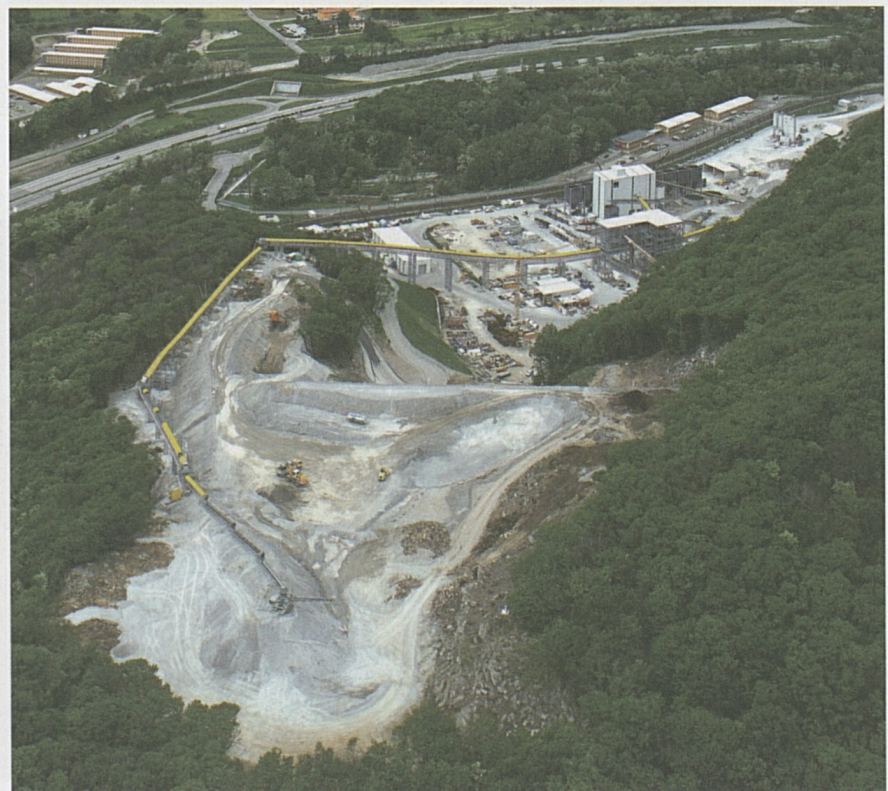
Panoramica sulle installazioni di cantiere "Prati di Regada"