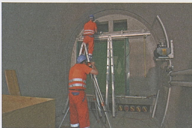
Installazione della porta in un cunicolo trasversale.

Il getto delle banchine laterali in calcestruzzo, per la collocazione di tutti i cavi necessari per l'esercizio, procede secondo programma. Finora sono stati realizzati su ciascun lato 12'000 metri, ovvero il 75% della lunghezza complessiva del sistema di gallerie.