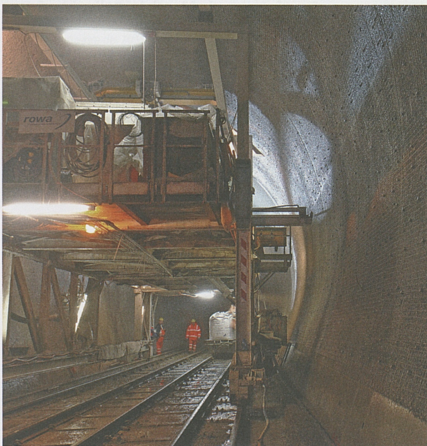
Posa dello strato di protezione antincendio.

A Bodio proseguono i lavori di rivestimento antincendio e del getto delle banchine laterali in calcestruzzo.