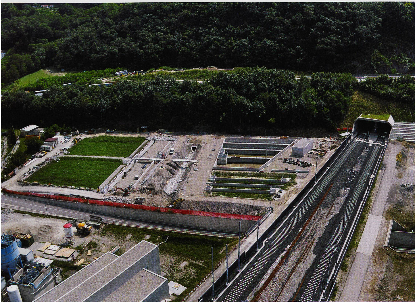
Portale nord Galleria di base del Ceneri, Camorino. Panoramica dell'impianto di smaltimento delle acque.

Nelle aree di cantiere all'aperto vicine ai portali nord e sud procedono le attività preliminari al collegamento alla linea esistente, in particolare sono state completate le fondazioni su cui sono stati già posati i pali e tutti gli elementi per la futura linea. Anche la posa dei ripari fonici è stata completata.