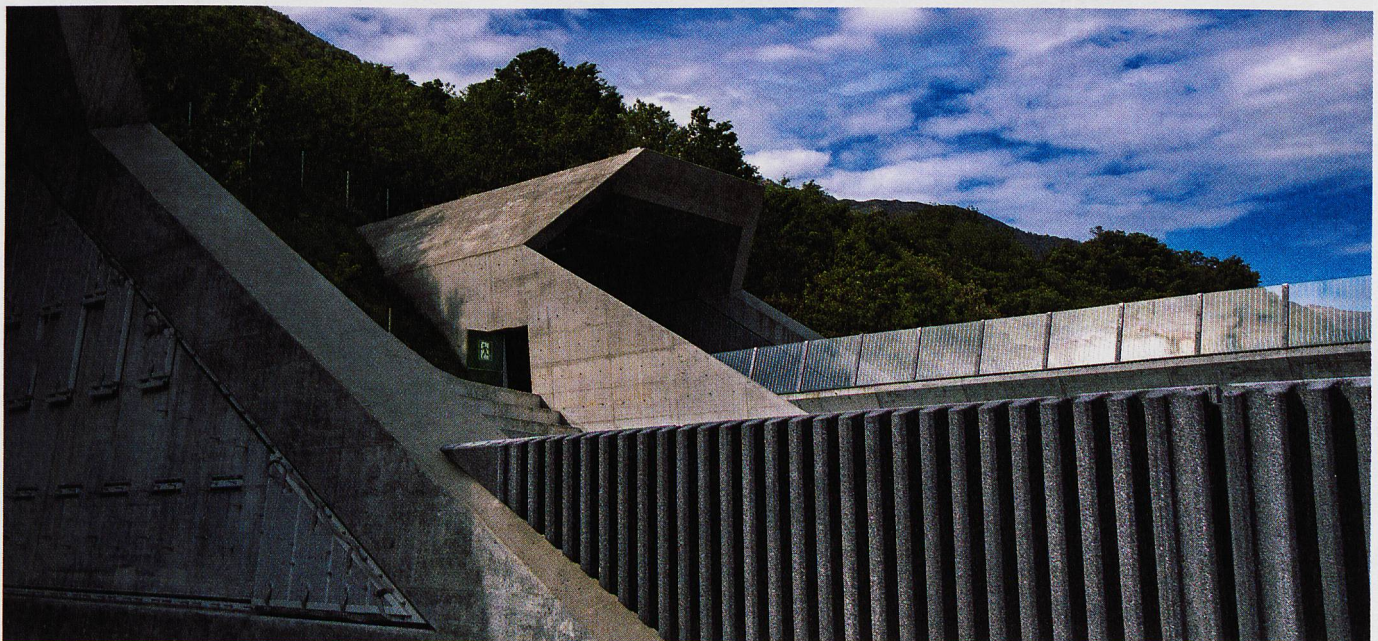
Galleria di base del Ceneri. In alto: è iniziato lo smontaggio delle installazioni provvisorie. In centro: la posa della catenaria rigida è terminata e i ventilatori sono stati installati. In basso: portale nord a Vigana.