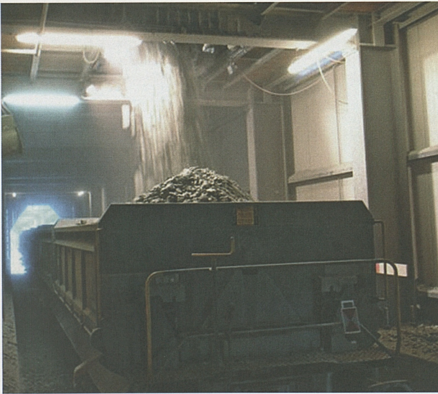
2,4 Millionen Tonnen Material wurden in 2400 Zügen von Amsteg nach Flüelen transportiert.