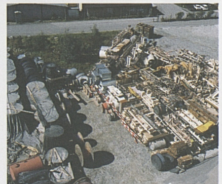
Die Demontage der beiden Amsteger Tunnelbohrmaschinen schreitet zügig voran.