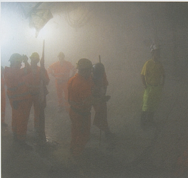
Kurz vor dem grossen Auftritt: Die Mineure warten gespannt unter der Tunnelbohrmaschine.