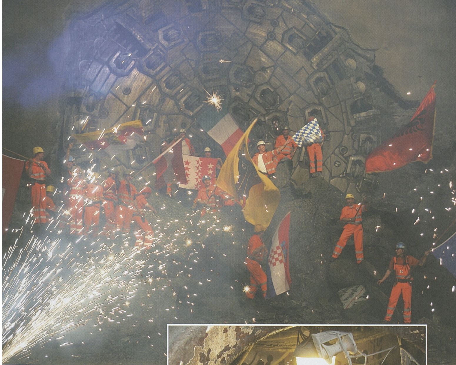
Bis die Funken sprühen: Mineure freuen sich über den Durchschlag in der Weströhre.

152 Kilometer langen Tunnelsystem Gotthard-Basistunnel – inklusive aller Stollen und Schächte – wurden rund 56 Prozent mit Tunnelbohrmaschinen und 44 Prozent im Sprengvortrieb ausgebrochen. Insgesamt wurden dabei mehr als 28 Millionen Tonnen Fels und Gestein aus dem Berg transportiert.