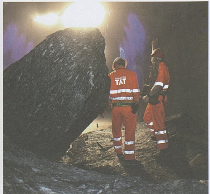
Gruss nach Sedrun: Über die grossen Gesteinsbrocken steigen die Mineure zu ihren Kollegen nach Sedrun.