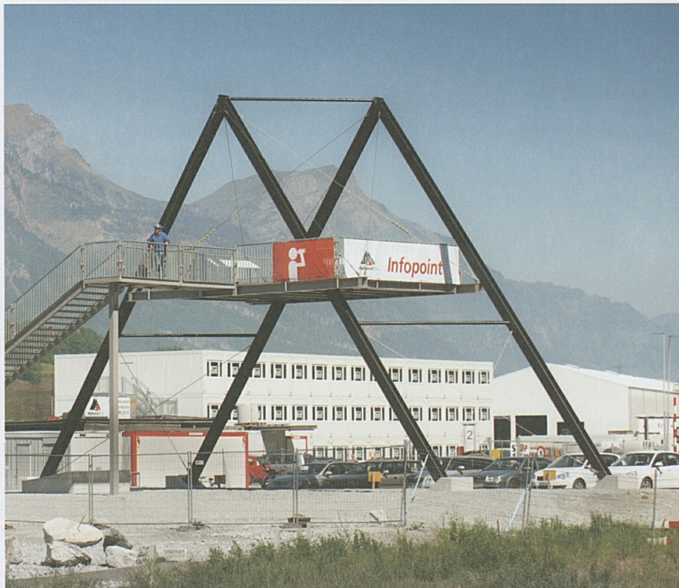
Gute Aussichten: Vom Infopoint «Bahntechnik-Installationsplatz» hat man freie Sicht auf die Baustellen.

Zwei neue Plattformen im Rynächt und bei der Schächenmündung bieten Informationen zu den Bauvorhaben und beste Sicht auf die Baustellen.