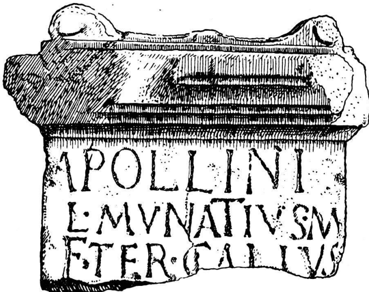
Abb. 3. Apollo-Altar im Tempel von Unterwindisch. Die Inschrift lautet auf deutsch: Dem Apollo hat Lucius Munatius Gallus, Sohn des Marcus, aus dem teretinischen Bezirk (Tribus).. (sein Gelübde mit Freuden und nach Gebühr erfüllt). — Wirkliche Breite der Inschriftfläche 55 cm.