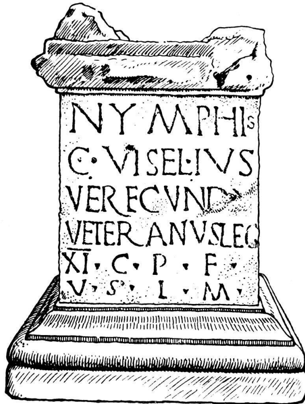
Abb. 2. Nymphenaltar im Tempel von Unterwindisch. Die Inschrift lautet auf deutsch: Den Nymphen hat Caius Viselius (Visellius?) Verecundus, Veteran der elften Legion, der Claudischen, pflichtgetreuen, sein Gelübde mit Freuden und nach Gebühr erfüllt. — Wirkliche Breite der Inschriftfläche 33\frac{1}{2} cm.