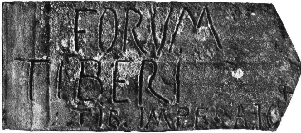
Dachziegel von Baldingen, siehe Excurs Seite 8. Länge 39,5, Breite 16,5 cm.