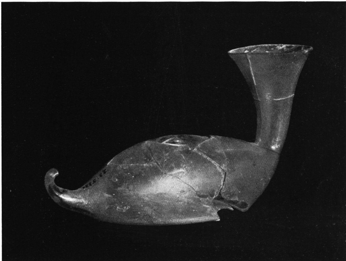
Glasgefäß mit trompetenförmiger Öffnung aus einem Brandgrab, gefunden am Bahnhof Brugg. Länge 14 cm. Siehe Seite 4.