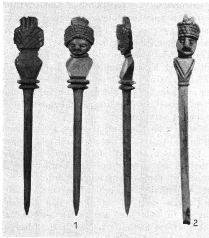
Abb. 3. 1 und 2 Vindonissa (1 Brugg, Museum; 2 Schweiz. Landesmuseum) 2:3 (Phot. Schweiz. Landesmuseum).

Ob der Typus der eine Büste haltenden Hand vielleicht überhaupt auf das 1. Jh. n. Chr. beschränkt ist, wird nur eine zusammenfassende Behandlung dieser Gruppe abklären können. Das bis auf geringe Maßunterschiede identische Fragment Nr. 2 (Abb. 1, 2) gehört jedenfalls auch in diese Zeit. Genannt sei noch ein entsprechender Haarpfeil von London 8) , dessen schlangengebänderschmückte Hand eine Isisbüste hält, deren Form gleichfalls in die 2. Hälfte des 1. Jh. n. Chr. weist.