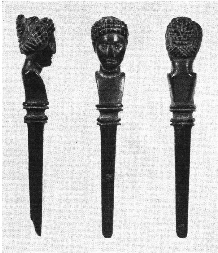
Abb. 2. Vindonissa (Brugg, Museum) 1:1.

Dabei waren zur Zeit der Niederschrift der Amores (ca. 25. v. Chr.) die Créations verglichen mit den späteren noch geradezu einfach. Diese lassen sich nun in ihrer Entwicklung auf Grund der Münzporträts kaiserlicher Damen von Nahem verfolgen und oft aufs Jahr datieren.