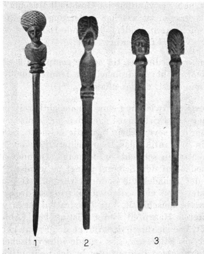
Abb. 4. 1 Castle Newstead (Edinburgh, National Museum), 2 Sidon, 3 Palästina (2. 3. Beyrouth, Museum of the American University) 2:3

tracht (Abb. 4, 2), die man vom berühmten „schönen“ Kopf im kapitolinischen Museum kennt 14) . Doch liegt gerade in dieser absurden Überhöhung der Stirnpartie – wohl nicht ohne Beihilfe künstlicher Haare – schon der Keim zur weiteren Entwicklung. Unter zunehmender Vernachlässigung der Profilinie wird nun im Verlauf des 2. Jh. die Haartracht auf eine eindeutige Hauptansicht von vorne angelegt. Mit dieser frontalen Gebundenheit geht dann eine matronalere Auffassung des Frauenbildnisses zusammen. Grundlage dazu bietet in echt römischer Weise das dargelebte Beispiel der Kaiserinnen. Denn erst mit Plotina gewinnt – von Livia natürlich abgesehen – die Kaiserin als wirkliche mater patriae und weibliche Ergänzung des princeps auch offiziell einen wichtigen Platz im Kosmos des Staates.