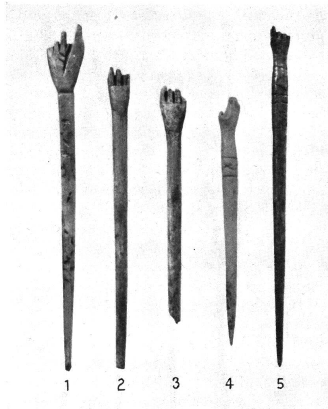
Abb. 8. 1. 2. 3. 5. Vindonissa (1–3 Brugg, Museum; 5 Schweiz. Landesmuseum), 4 Aquae Helveticae (Baden, Heimatmuseum) 2:3.

in den römischen Kulturbereich einmal in ihrem verspielten weiblichen Aspekt dartut, während hier sonst der männlich-kriegerische das Feld durchaus beherrscht.