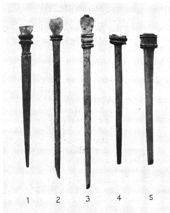
Abb. 6. 1-5 Vindonissa (Brugg, Museum) 2:3.