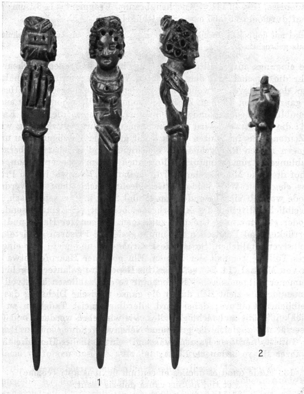
Abb. 1. 1 und 2 Vindonissa (Brugg, Museum) 1:1.

8. Vindonissa, Inv. 2222 f. – Bein, hellgelblich – Fragment – L. 10,8 cm; Büste 1,25 cm; größter Schaftdurchmesser 0,45 cm – Schutthügel 1904 – Abb. 6, 3.