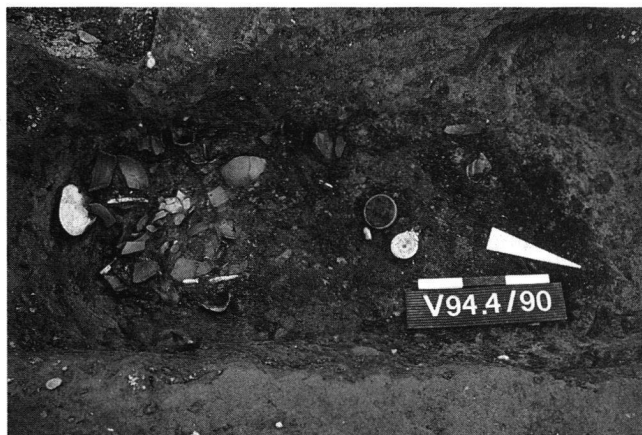
Abb. 6 Windisch-Dägerlirain 1994 (V.94.4): Freigelegtes Brandgrab (Bustum) mit Beigabengefässen.

63f. – inzwischen als Lizentiatsarbeit ausgewertet). Für diese Parzelle stand ein Überbauungsprojekt für sechs grosse Mehrfamilienhäuser mit gemeinsamer, durchgehender Unterflurgarage vor der Realisierung. Die erste Bauetappe war für das Gebiet geplant, das direkt westlich der Grabungsfläche von 1993 liegt.