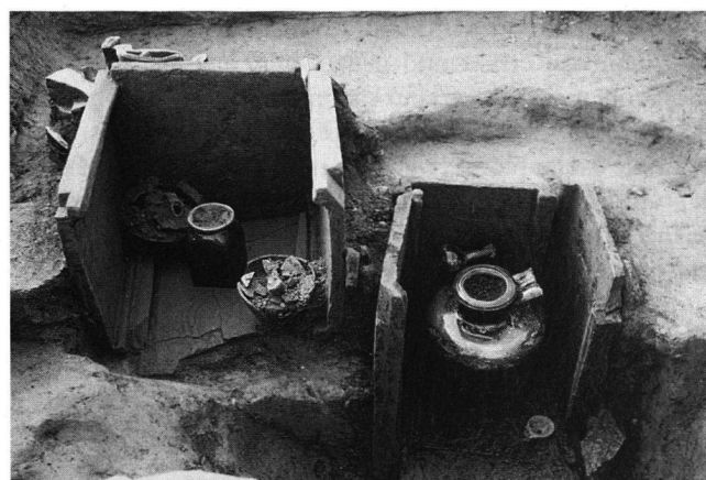
Abb. 7 Windisch-Dägerlirain 1994 (V.94.4): Zwei Ziegelkistengräber mit Glasflaschen als Urnen und Gefässbeigaben.

Von den rund 300 nachgewiesenen Gräbern waren fast alle Brandgräber. Bei den meisten handelte es sich um Brandschüttungsgräber; lediglich etwa 10% enthielten Urnenbestattungen. Die Gräber selber bestanden meistens aus einfachen Gruben, in denen wiederholt Holzkisten nachgewiesen werden konnten oder die selten Ziegelkisten enthielten. Sicher die Hälfte der Brandschüttungen wurden in Holzkisten beigesetzt. Viele Gräber enthielten Beigaben, die den üblichen Rahmen nicht sprengen: Gefässe aus Ton oder Glas, die wohl in vielen Fällen als Behältnisse für Speisebeigaben dienten, sowie auch persönliche Gegenstände wie Schmuck, Öllämpchen, Münzen, Parfümfläschchen, Spiegel usw. Vergleichsweise reiche und aufwendiger ausgestattete Gräber bildeten die seltenen Ausnahmen. Die