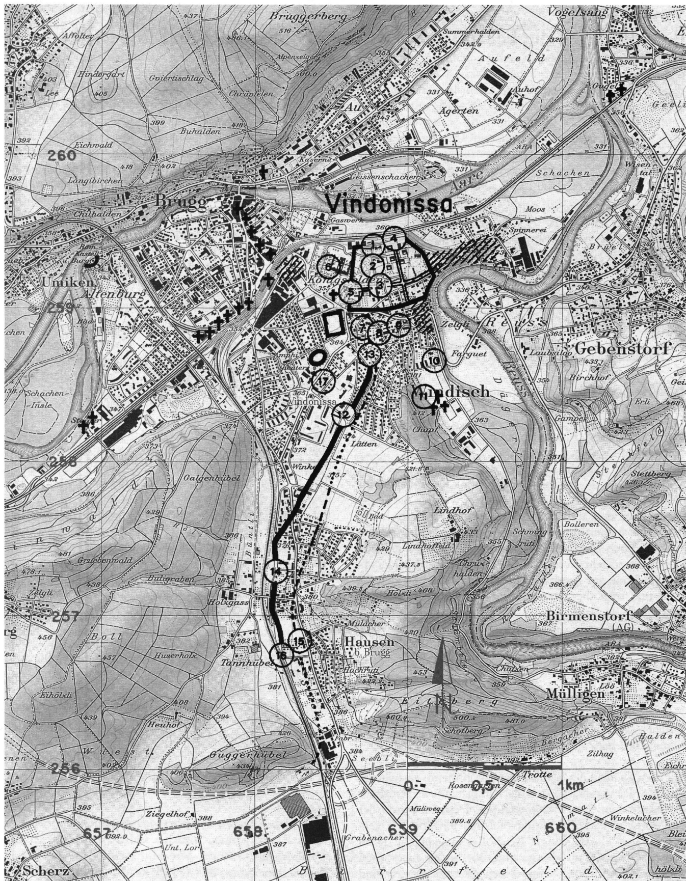
Abb.1 Situationsplan 1:25 000. Vindonissa und die besprochenen Fundstellen (Fundstellen-Numerierung gemäss Artikel). Reproduziert mit der Bewilligung des Bundesamtes für Landestopographie vom 4.8.1995.