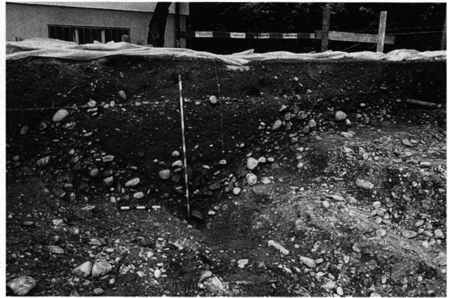
Abb. 3 Windisch-Am Rain 1994 (V.94.2): Das Spitzgraben-Profil im Baugrubenrand; Ansicht aus Osten.

Da die Bewegungsmöglichkeiten in dem Privatgarten hinter dem Haus eingeschränkt waren, wurde die systematische Ausgrabung ohne vorgängige Sondierungen direkt begonnen. Um so grösser war die Überraschung, dass unter Humus und wenig Unterboden ungestörter, gewachsener Kies vorlag. Einzig im nördlichen Abschnitt des Grabungsfeldes verlief wenig tief in west-östlicher Richtung ein etwa 1,2 m breiter und 40 cm tiefer gemauerter Fundamentstreifen aus Geröllen mit einer flach abgestrichenen Mörteloberfläche. Nach dem Verlauf zu schliessen, muss es sich dabei um das Fundament zu einem Wasserleitungskanal handeln, der wenig westlich bereits 1906 auf der Länge von 50 m nachgewiesen wurde; dagegen wurde damals die Breite des Fundaments mit bloss 65 cm angegeben (ASA NF9, 1907, 33). Unser Fundamentstreifen liess sich – wie damals auch der Wasserleitungskanal – weder durch die Bautechnik noch durch Funde datieren; der Aufbau entspricht sicher nicht den Elementen der beiden bekannten römischen Wasserleitungskanäle von Hausen bzw. dem Birrfeld nach Vindonissa.