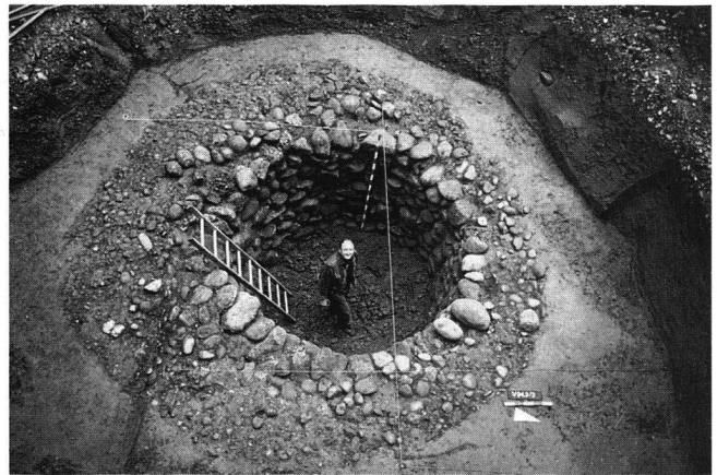
Abb. 2 Windisch-Königsfelden Klinik Hauptgebäude 1994 (V.94.3): Aufsicht auf den freigelegten römischen Schacht.

Beim vorsorglichen Voraushub stiessen die Mitarbeiter der Kantonsarchäologie ungefähr 1,2 m unter der Grasnarbe und überdeckt vom Bauhorizont zum Hauptgebäude auf