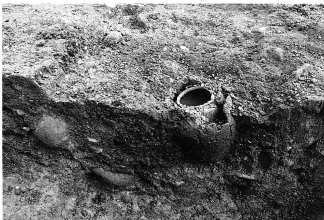
Abb. 4 Windisch-Dägerlirain 1994 (V.94.4): Zur Hälfte freigelegtes Urnengrab mit der Urne und Beigabengefäss im Mittelprofil.