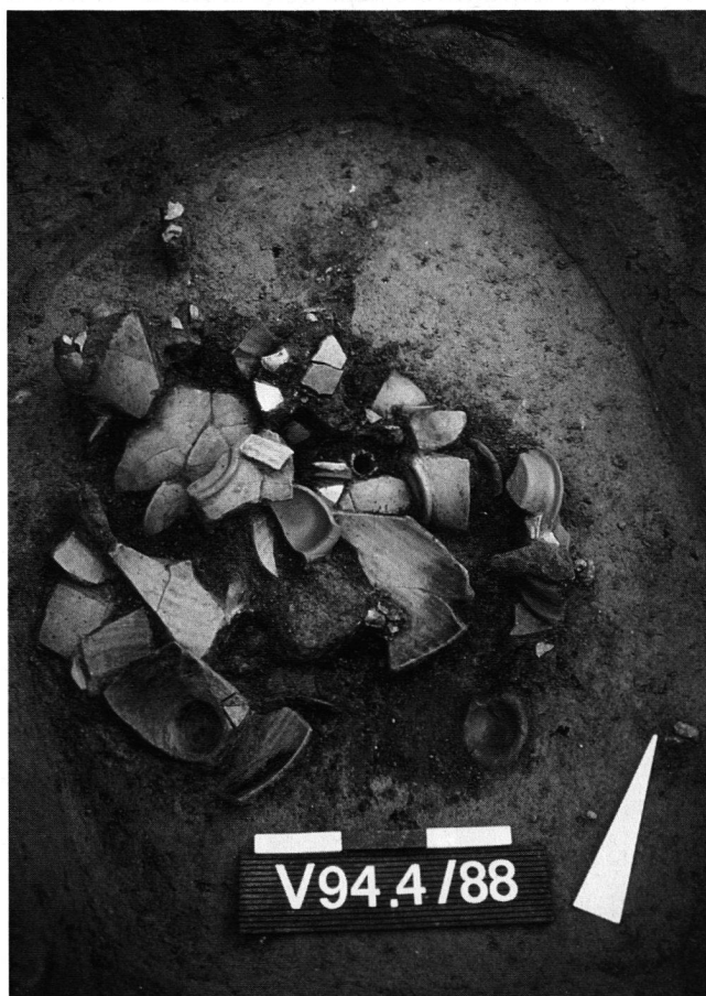
Abb. 5 Windisch-Dägerlirain 1994 (V.94.4): Brandschüttungsgrab mit viel zerschlagener und durch die Brandhitze versprengter Beigabenkeramik.

untersucht werden sollte. Dabei wurden auf einer Fläche von 1400m 2 in einer Tiefe von 0,6 bis 2m unter der Grasnarbe 340 Bodenverfärbungen festgestellt, von denen rund 300 als Gräber identifiziert werden konnten; erneut wurde nach rund 50m das nördliche Ende des Gräberfeldes eindeutig festgestellt. Das übrige, nördliche Areal der Parzelle wurde im Bereich des Bauprojekts mit 15 Bagersondierschnitten mit einer Gesamtlänge von 480m ohne positive archäologische Funde oder Beobachtungen abgetastet.