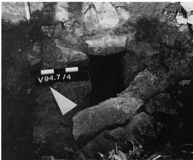
Abb. 8 Windisch-Dohlenzelgstrasse/Jurastrasse (Parz. 2848) 1994 (V.94.7): Einsicht in den Baggersondierschnitt mit dem abgedeckten römischen Wasserleitungskanal.

Aus diesem Grund wurde die römische Wasserleitung mit drei Schnitten erfasst und genau eingemessen. Bei dieser Gelegenheit wurden erneut soweit wie möglich Innenaufnahmen mit dem Kanalisationsfernsehen gemacht. Obwohl die Stelle bloss etwa 25 m nördlich – d. h. in Fliessrichtung unterhalb – von Einstiegschacht Nr. 2 liegt, gelang es nicht, mit der Fernsehkamera bis zu ihm vorzudringen. Leider mussten wir feststellen, dass die Leitungsstrecke in diesem Bereich durch Schlamm oder Schwemmpartikel auf der Sohle recht stark verschmutzt ist.