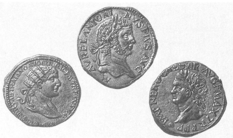
Münzen: Fr. 1.- bis 10.-