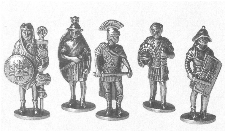
Zinnlegionäre: Fr. 1.50 bis 8.-