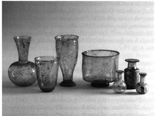
Abb. 10: Die bestimmbaren Gläser der Fundstelle Windisch Dammstrasse. V.l.n.r. V.98.4/13.3 (Grab 10), V.98.4/16.12 (Grab 17), V.98.4/16.13 (Grab 17), V.98.4/14.3 (Grab 11), V.98.4/22.4 (Grab 22), V.98.4/16.11 (Grab 17), V.98.4/16.16 (Grab 17).

Die einzige gläserne Flasche im Fundgut stellt die im Bauchteil relativ dünnwandige, frei geblasene Flasche mit Trichterhals des Typs Isings 104b (Taf. 3,A3) aus Grab 10 dar. Auf Hals, Schulter und im unteren Drittel des Bauches ist sie jeweils mit einer Schliffzone verziert. Ungewöhnlich ist eine plastische «Schlaufe» auf dem Bauch. Gute Vergleiche zu unserem Stück mit solchen, wohl der Verzierung dienenden «Schlaufen» sind selten und immer mit einer grösseren Anzahl dieser Schlaufen verziert. So