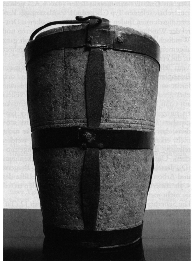
Abb. 11: Der Lavezeimer aus Grab 17. Gut sichtbar sind die rhombisch zugeschnittenen Zwischenstücke der Blechfassung.

In diese Gruppe gehört ebenfalls nur ein Gefäß, ein spätrömisches Balsamarium der Form Augst 73 (Taf. 5,C4) 207 . Es stammt aus Grab 19. Vergleiche finden sich vor allem in spätrömischen Gräbern nördlich der Alpen, aber auch in Siedlungsschichten, so unter anderem in Lankhills, Tongeren, Krefeld-Gellep, Trier, Yverdon, Kaiseraugst und Windisch 208 . Die Vergleiche datieren vorwiegend in die erste Hälfte des 4. Jh. Eine Ausnahme stellt das Grab aus Krefeld-Gellep dar, welches aufgrund der Befunde eher in die zweite Hälfte des 4. Jh. gehört 209 .