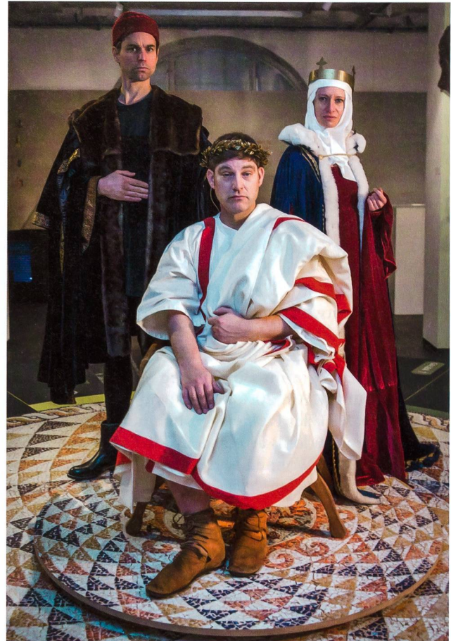
Abb. 5: Kaiser Nero, Königin Agnes und König Louis XI – dargestellt von Schauspielerinnen und Schauspielern.

Im Jahr 2017 fanden mehrere Veranstaltungen statt, von denen im Folgenden eine Auswahl erwähnt sei. Am Dreikönigstag (6. Januar) erfolgte die Schlüsselübergabe von der Kantonsarchäologie Aargau an das Museum Aargau. Begleitet wurde der Anlass von einem Schauspiel, in welchem Kaiser Nero, Königin Agnes und König Louis XI um Macht und Zuständigkeiten stritten (Abb. 5). Zu-