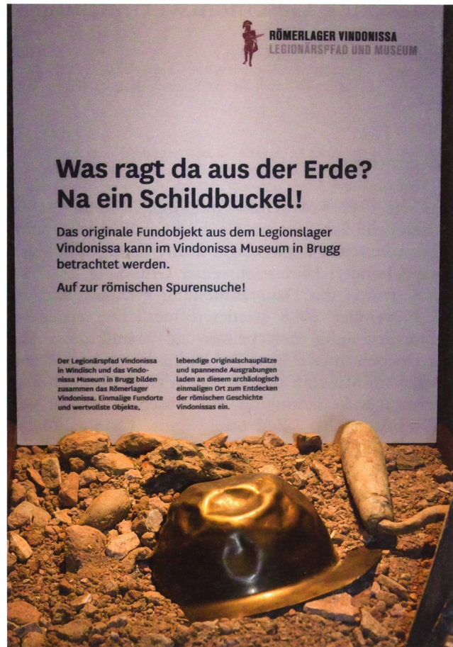
Abb. 2: Vitrine beim Legionärspfad mit Verweis aufs Vindonissa Museum.

Zur Erreichung dieser Ziele liegt der Fokus auf der Schaffung von aufeinander abgestimmten Angeboten, die zu einem Besuch beider Institutionen anregen. Daneben wird der Erlebnisfaktor in der Dauerausstellung des Vindonissa Museums für Familien und Individualbesucher durch erzählende Vermittlungsstränge, neue Vermittlungsangebote und Veranstaltungen erhöht. Am