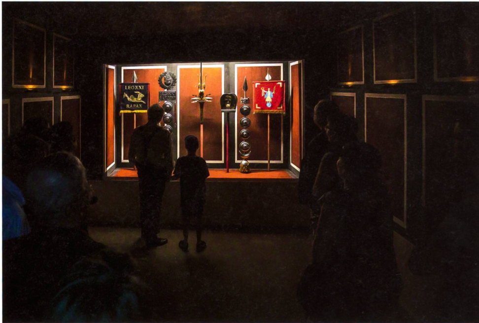
Abb. 8: Blick in die neue Station «Fahnenheiligtum» des Legionärspfad.

Dieser Kaiserbesuch wurde mit einer eindrucklichen Quadriga – einem vierspännigen Streitwagen – als Höhepunkt des Eröffnungsfestes nachgestellt.