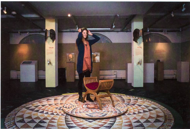
Abb. 3: Die Sonderausstellung «Kampf um Neros Erbe – Die Helvetier zwischen den Fronten».

Der Schwerpunkt der Vermittlungsangebote lag bei der vom 18. November 2016 bis 12. November 2017 dauernden, von der Kantonsarchäologie Aargau initiierten und produzierten Sonderausstellung «Kampf um Neros Erbe – Die Helvetier zwischen den Fronten», die das Museum Aargau als fertige Ausstellung übernehmen konnte (Abb. 3). Die Ausstellung thematisierte das Vierkaiserjahr 69 n. Chr. und seine Auswirkungen auf Vindonissa 2 . Die dazugehörige Führung, die je nach Zielpublikum entsprechend angepasst wurde, verlieh der Thematik eine für das Publikum beeindruckende Vertiefung, da auf individuelle Fragestellungen und Bezüge eingegangen werden konnte.