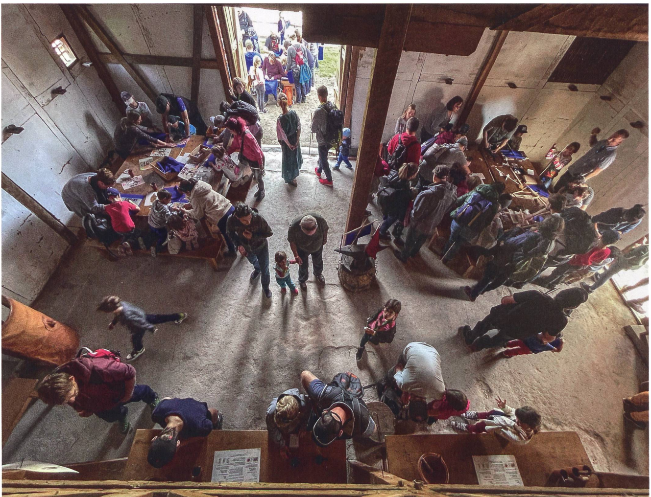
Abb. 6: Das rege genutzte Angebot Standarten basteln am Vindonissapark-Fest.