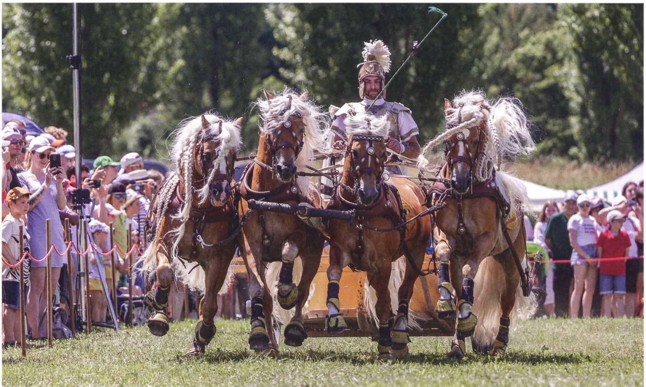
Abb. 4: Wagenrennen mit Vierspanner ( quadriga ) am Römertag Vindonissa.