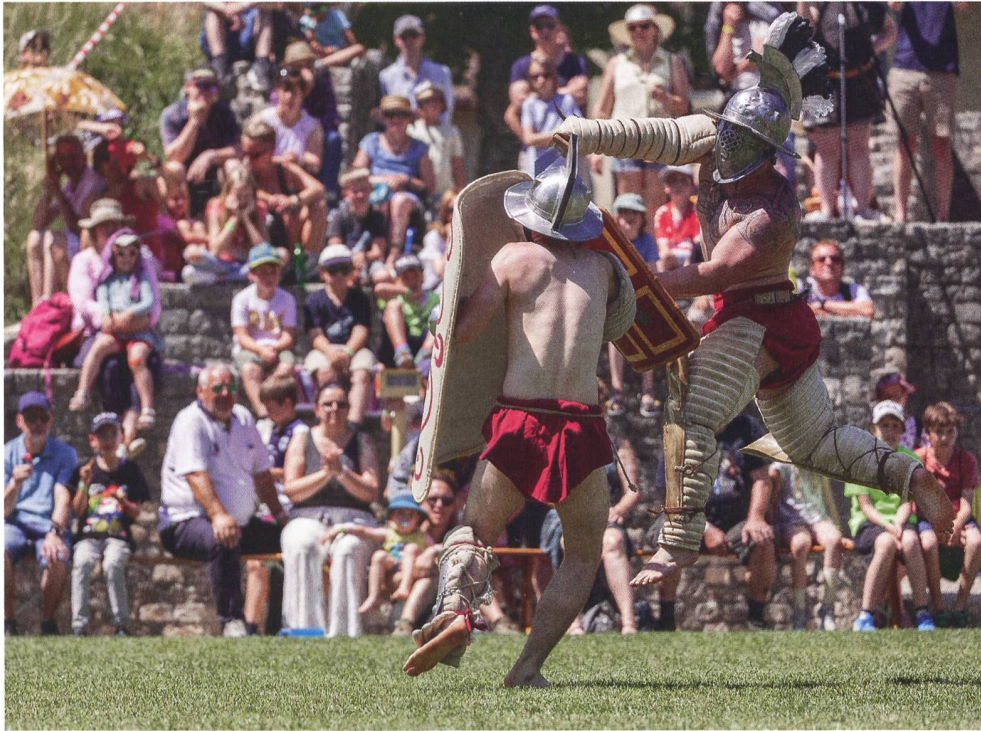
Abb. 5: Gladiatorenkämpfe am Römertag Vindonissa.