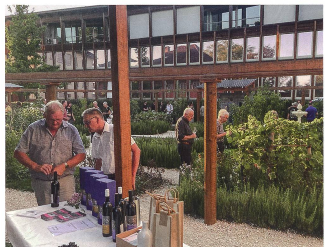
Abb. 9: Die Vindonissa-Winzer am Weinabend im römischen Garten vom 25. August 2022.