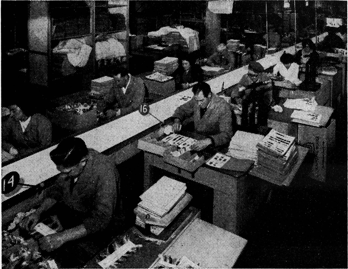
Herstellung von Musterkarten für gefärbte Schafwolle Zusammenarbeit mit Firma der Privatindustrie

einem festen Auftragsbestand rechnen können und uns um den Absatz der Waren nicht sorgen müssen.»