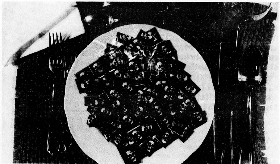
Illustration: Walter Erb

allerdings nur ein Nebenschauplatz, solange die Anreizstrukturen auf eine Ausbeutung des Systems ausgerichtet sind. Man kommt nicht umhin, mit einer höheren Kostenbeteiligung den Versicherten vor sich selbst zu schützen. Nur wenn der Versicherte an den Kosten beteiligt wird, wählt er das billigste Angebot. Zu solchen Angeboten gehören Gesundheitszentren, welche ihre Leistungen in Form einer Gesundheitskasse (HMO) er-