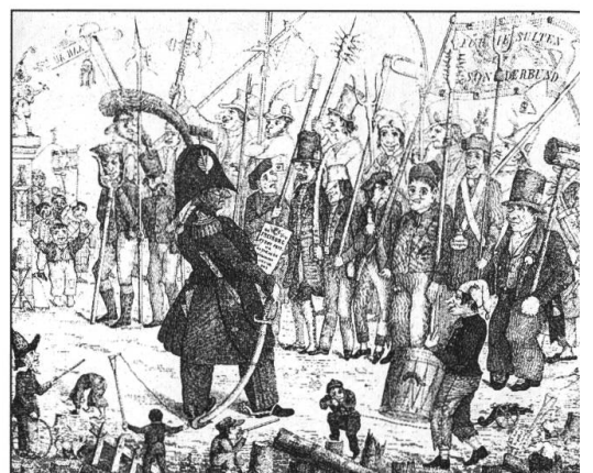
Les soldats fribourgeois du landsturm vus par les radicaux. Caricature contemporaine des événements. Musée d'art et d'histoire, inv. 12937.