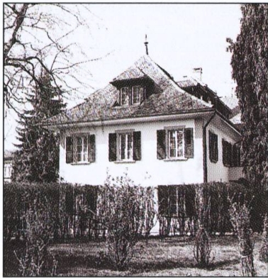
Le «château» de Bertigny, aujourd'hui intégré dans l'établissement des Sœurs ursulines.