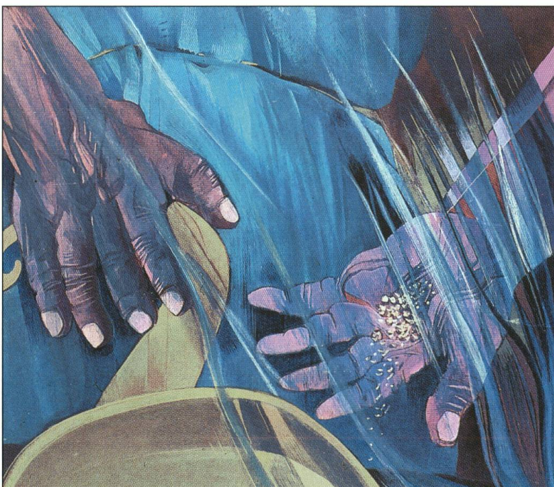
Jacques Cesa (1945). Les mains du fromager. Peinture acrylique sur panneau, 1993. Propriété privée