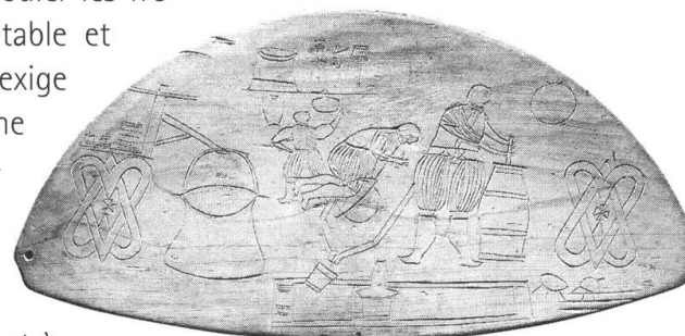
Planche à presser le fromage.