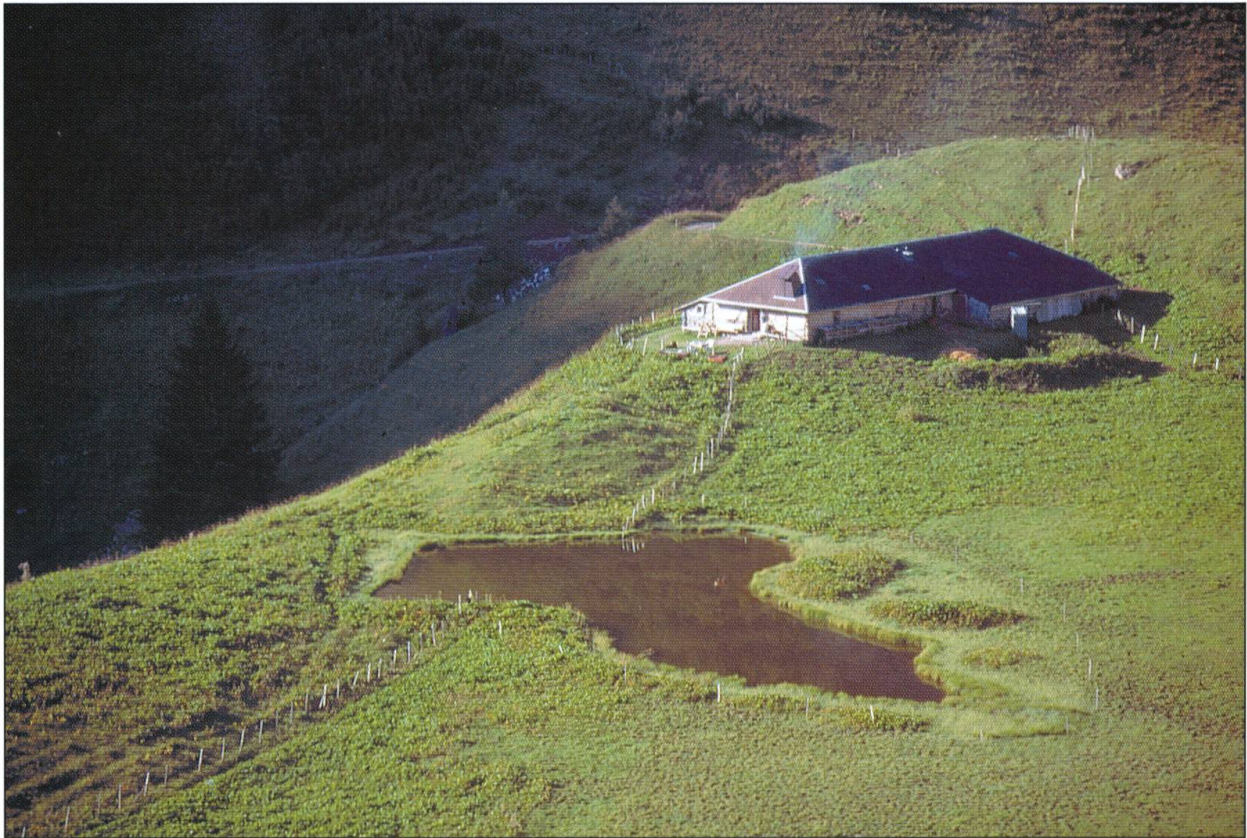
Chalet de Gros Sador (Grandvillard).