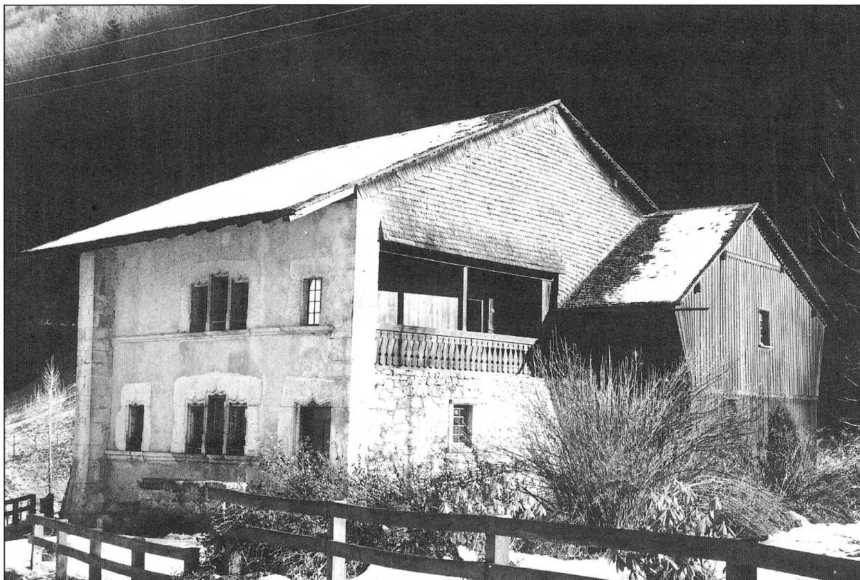
La maison du banneret Pierre de la Tinaz (1666) à Grandvillard, emblème architectural de ce XVIII e siècle fromager.

grimpent durant la première moitié du XVIII e siècle la production et l'exportation du fromage de Gruyère.