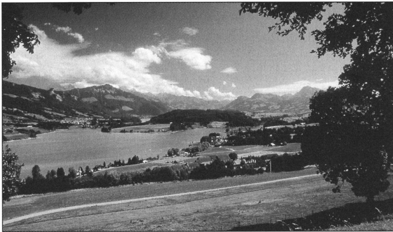
Les rives du Lac de la Gruyère sont actuellement au centre d'un vaste projet de réhabilitation.

La Gruyère touristique devra au cours des prochaines années, calquer plus étroitement sa stratégie sur celle des organisations faïtières. Il lui appartiendra de travailler plus sérieusement le capital humain (développer le professionnalisme), d'attirer une main-d'œuvre mieux formée, d'améliorer globalement l'attrait de sa destination en jouant la carte de la qualité et de la création de produits originaux et stratégiques (par la mise en valeur de la culture populaire au moyen d'un événement répétitif à portée internationale, à titre d'exemple).