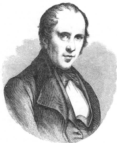
Rodolphe Toepffer (1799-1846)

«Il faut donc que la Suisse prenne part à la marche éclairée de l'Europe. Nous construirons des chemins de fer, c'est bien, c'est très bien; mais nous n'oublierons pas d'attacher un fanal à nos locomotives pour éclairer leur route. Car la chute est facile à qui marche dans l'ombre.» ( L'Emulation , N° 16, 1846, p. 253).