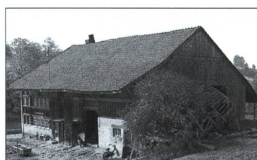
La ferme de Longemort, à Hauteville.

Le pignon de l'habitation de Longemort ainsi que la façade principale, jusqu'à la hauteur des fenêtres du rez-de-chaussée, avaient été refaits en maçonnerie au XX e siècle. Lors de la démolition de la ferme, les parties en bois de l'étage furent récupérées pour les placer sous les fenêtres de la reconstitution. On décida aussi de restituer une couverture en tavillons sur le pignon en se basant sur une ancienne photographie du bâti-