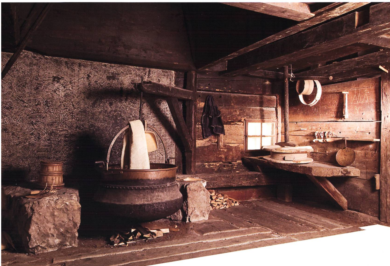
Le trintsâbyo du Gillerby, au Musée gruérien.