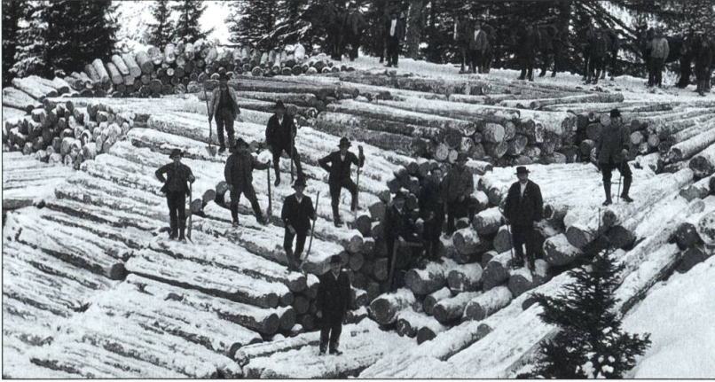
Billons au Petit-Mont, 1928.