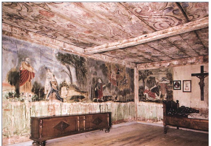
La chambre de Montévraz.