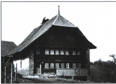
La ferme-manoir de Montévraz. La chambre peinte se trouvait dans les combles.

Contrairement aux deux ensembles précédents, la chambre peinte n'est pas représentative de l'habitat régional. Elle provient de la ferme-manoir de Montévraz-Dessus (commune du Mouret) construite en 1673 par Jean-François Kaemmerling, patricien de Fribourg, et faisant partie d'un grand domaine où se trouvaient deux manoirs, des ruraux, une chapelle et un four à pain. La chambre peinte se trouvait dans les combles. Elle n'était donc pas un pêyo . Elle n'avait aucun moyen de chauffage et pas de liaison directe avec une cuisine. Un lit y trouvait place dans l'angle situé derrière la porte. L'intérêt de cette pièce bâtie avec des planches et des poutres grossièrement équarries réside dans son décor peint entre la fin du