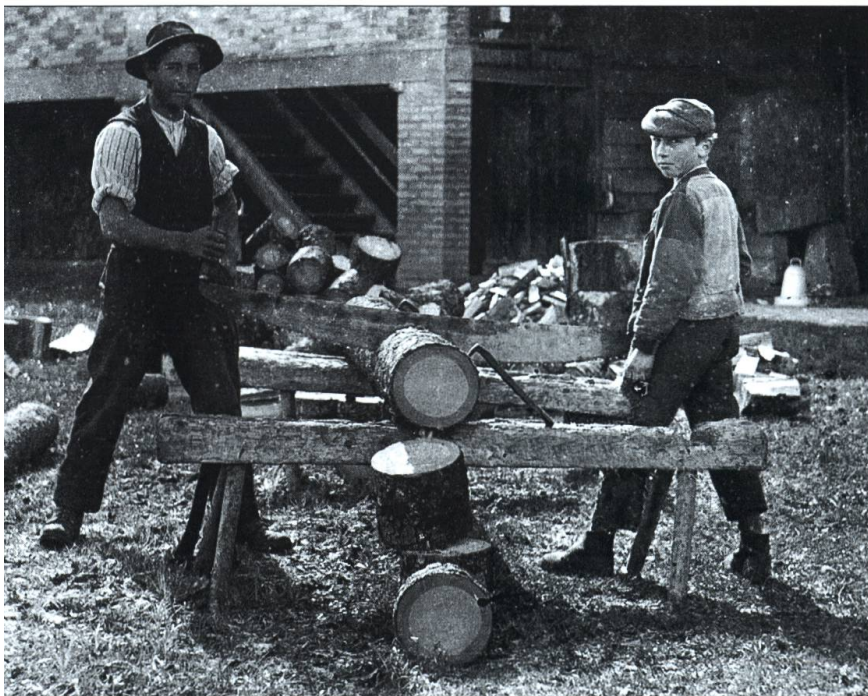
Scieurs à Riaz, vers 1900.