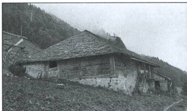
Le chalet du Gillerby, sur les contreforts de la Dent-de-Broc. Sur le linteau de la porte du trintsâbyo était gravée la date: 16 MAY 1793.

En avril 1977, un appel fut adressé à toutes les communes de la Gruyère, dans l'espoir qu'elles signalent un ou des chalets qui devraient être transformés ou démolis. Par chance, la commune de Broc nous fit savoir qu'elle prévoyait de démolir deux petits chalets voisins en mauvais état, le Gillerby et la Gîte-à-Pâquier, pour les remplacer par un bâtiment plus grand permettant une exploitation rationnelle. Le chalet du Gillerby, construit en 1793, convenait tout à fait à notre attente. Les éléments qui nous intéressaient furent démontés en août déjà et fidèlement remontés au Musée. Tout au plus fallut-il raccourcir la «borne» pour tenir compte de la place disponible.