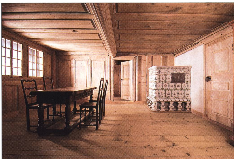
La grande chambre de Hauteville.