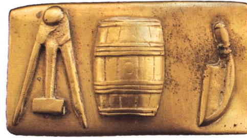
Boucle de ceinture aux insignes de tonnelier provenant de la maison du café du Tonnelier, à Bulle. Musée gruérien.

«Edit en trois articles, le premier consistant au fait que 50 troncs de bois peu endommagés des forêts de qualité supérieure, soit au Bois des Arches, ou n'importe où ailleurs sont démarqués par l'«officier» de Gruyères à l'entrepreneur, à savoir le R. Dom Corboud de la Tour pour l'établissement de son magasin et au cas où ce bâtiment serait couvert de tuiles, dont 6000 seront mises à disposition gratuitement, qu'il pourra obtenir soit au château de Gruyères soit dans la tuilerie; et au cas où le bâtiment couvert ne pouvait pas être terminé par manque de chaux, il est ordonné au «fabricant de chaux» de donner jusqu'à 25 tonneaux audit Sieur Corboud payé en avance. 2do. Concernant la gratification réclamée de 5 Batz pour chaque tonneau fabriqué pendant 1 année, la haute Commission estime que celle-ci peut être bien réduite de 7 Kreuzer et uniquement pour celle de tonneau destiné à l'étranger, dont Son