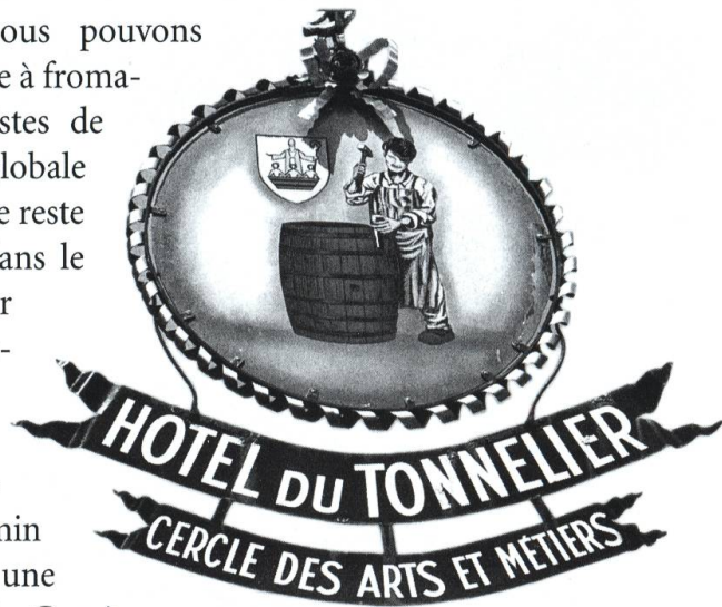
Enseigne du café Le Tonnelier, à Bulle.

Au regard de ce petit parcours, nous pouvons aujourd'hui définitivement classer la tonnellerie à fromages dans les métiers disparus. Quelques pistes de recherches ont été ouvertes mais une étude globale des métiers induits par la production fromagère reste à faire. La tonnellerie à fromages disparaît dans le courant du XIX e siècle, avec la fin de l'âge d'or du Gruyère. Déjà fortement touché par les événements révolutionnaires de France, le commerce du fromage de montagne périlite en raison d'une baisse de la qualité et du démarrage de la production en plaine. L'arrivée du chemin de fer, à la fin du XIX e siècle, ne permet pas une renaissance de la tonnellerie, même lorsque le Gruyère retrouve une aura internationale.