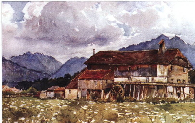
La scierie Dubas. Aquarelle peinte par un interné français pendant la guerre de 1914-1918.