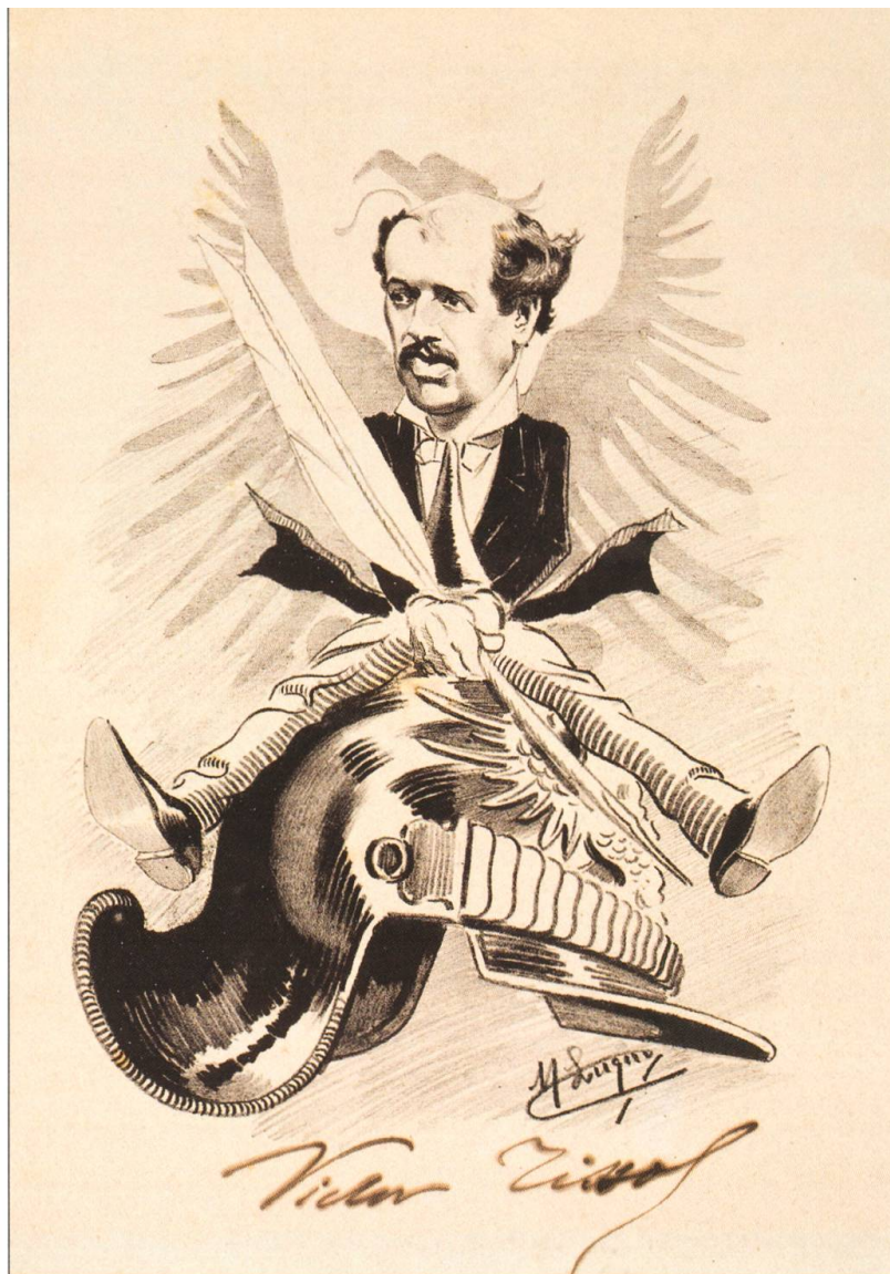
Caricature de l'auteur du Voyage au Pays des Milliards . MGB.

Comme de nombreux jeunes lettrés romands, il est irrésistiblement attiré par la Ville Lumière: c'est à Paris que semblent réalisables tous les idéaux, qu'ils soient économiques ou