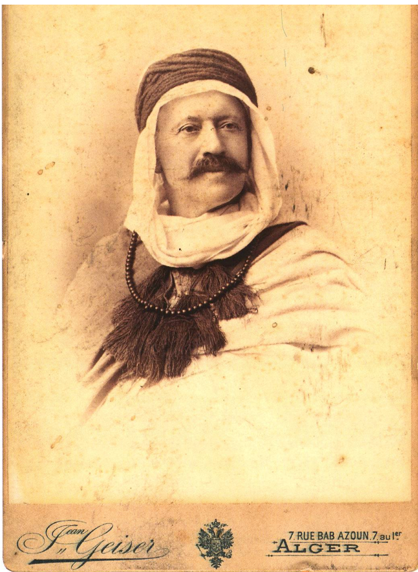
Victor Tissot déguisé en homme du désert. MGB. Photo Jean Geiser, Alger.

tions. Il est, sans conteste, l'écrivain suisse le plus édité de tout le XIX e siècle. Son activisme éditorial est impressionnant 17 . Voyageur impénitent, il privilégie les récits de voyage, racontés à la première personne, donnant ainsi à ses relations la saveur du témoignage et le pittoresque piquant du «vécu». Il s'adonne aussi à la fiction, édite des nouvelles dans La Revue contemporaine , Le Correspondant et La Revue de France et connaît des succès populaires avec des romans qui se déroulent dans les milieux interlopes de Moscou, Berlin ou Vienne, ou dans des contextes «exotiques». Citons comme illustrations Les Aventures de Gaspar van der Gomm , La Comtesse de Montretout , Au Pays des Nègres , Les Derniers Peaux-Rouges ... Ainsi, dans Les Mystères de Berlin (1879), rédigé en collaboration avec Constant Améro, fait-il évoluer un détective privé suisse nommé Ziegerbock dans une sordide affaire de recel de bijoux.