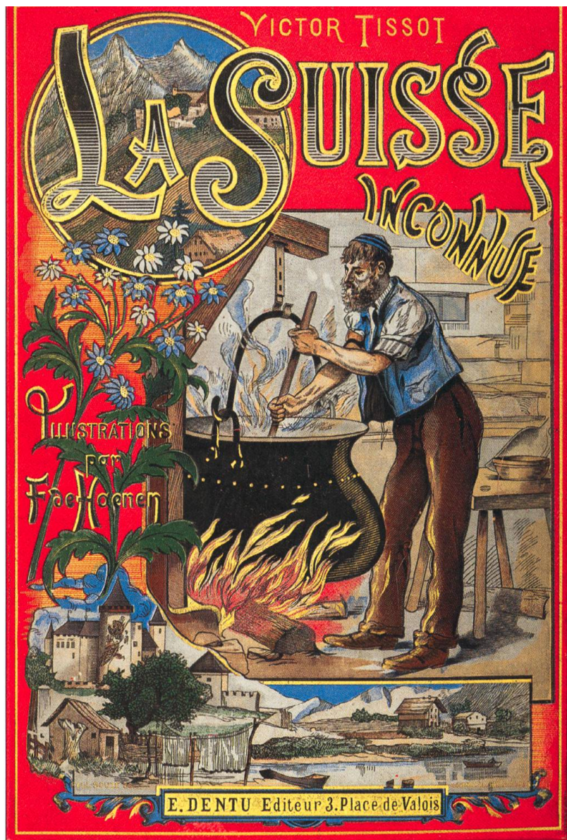
Couverture chromolithographique de La Suisse inconnue de V. Tissot. BCU Fribourg, cote RESQ 108.

Les modes passent, c'est bien connu, et l'œuvre de Victor Tissot, si parfaitement paramétrée pour toucher le lectorat de masse de la France de la Belle Epoque, connaît un rapide déclin après la mort de son auteur. Des 141 entrées figurant dans le catalogue de la Bibliothèque nationale de France, aucune n'est postérieure à 1916, année de publication de L'Allemagne casquée , dernière reprise du Voyage au pays des milliards . En Suisse, deux rééditions chez Payot à Lausanne de La Suisse merveilleuse , en 1917 et en