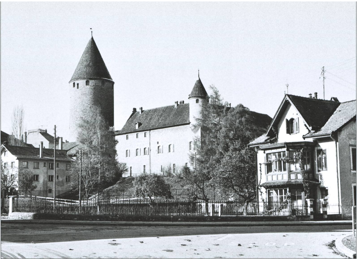
Le site du futur Musée gruérien, en 1973.