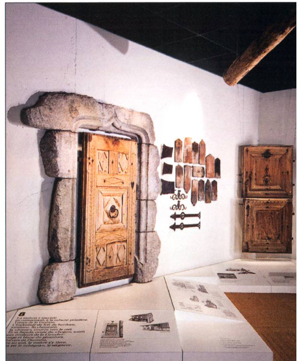
Reconstitution dans l'exposition permanente comprenant une cuisine et une chambre du XVIII e siècle. État 1979. Les reconstitutions ont été décrites dans les Cahiers du Musée gruérien 2007.