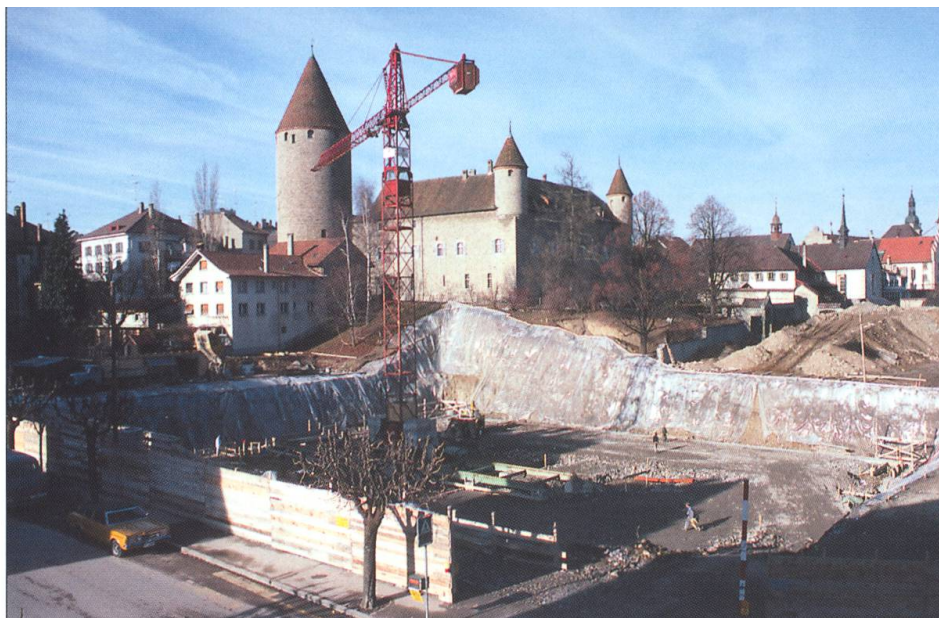
L'excavation pour le sous-sol du bâtiment. L'ouvrier donne l'échelle du chantier. Novembre 1975.

Dès l'automne 1973, le projet de construction s'accélère. Henri Blanc, retraité, ne pouvant pas assumer les études de détail, on les confie à l'architecte Roland Charrière 15 et Jean Moret est mandaté comme ingénieur. Présidée par André Glasson, la Commission de bâtisse œuvre avec assiduité, si bien que le projet est bientôt transmis au Conseil communal. Ce projet répartit la construction en parts presque égales entre le rez-de-chaussée et le sous-sol. La partie apparente a une surface de 1500 m 2 et un volume de 8000 m 3 , avec un corps principal aux façades aveugles et haut de 7.3 m. Le 4 février 1974, soit treize jours avant les élections communales, le Conseil communal approuve le projet à l'unanimité 16 . Les plans sont mis à l'enquête le 23 février 1974. Pour Auguste Glasson, l'objectif est atteint au terme de son mandat.