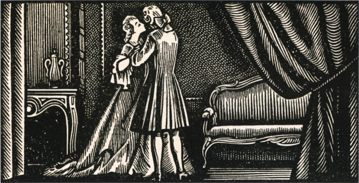
Beaumarchais et Marie-Thérèse Willermaulaz, bois gravé de Henri Jadoux pour le Beaumarchais de Sacha Guitry, éditions Raoul Solar, 1950.

M.-Th. Willermaulaz dans le Beaumarchais de Sacha Guitry «Je me suis dit: Ce soir, il faut qu'il ait tout. – et, comme je n'ai pas une amie qui me vaille, je suis venue moi-même. Vous devez bien penser que, pour agir ainsi, il faut que je sois quelqu'un de bien – sans quoi je serais quelqu'un de telle- ment mal!