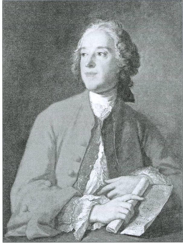
Pierre-Augustin Caron de Beaumarchais (1732-1799), d'après une huile sur toile de Jean-Marc Nattier (1685-1766), collection privée.

A défaut d'épouser une fille de noble extraction, Beaumarchais s'unit officiellement à une femme de grande classe. L'écrivain financier lui écrit de façon ostensible, depuis Kehl sur le Rhin, dans le Margraviat de Bade, où il achève l'édition des œuvres de Voltaire: «Je ne veux pas, ma chère amie, vous priver plus longtemps de la jouissance de l'état qui vous appartient; vous êtes ma femme, vous n'étiez que la mère de ma fille; il n'y a rien de changé à votre état antérieur; mais je désire que, dès ce moment, qui est le premier de mon absence, vous me représentiez honorablement dans ma maison, et que vous preniez mon nom qui est devenu le vôtre. Embrassez notre fille tendrement, et faites lui comprendre, si vous le pouvez, la cause de votre joie. J'ai rempli tous mes devoirs envers elle, envers vous. 12 »