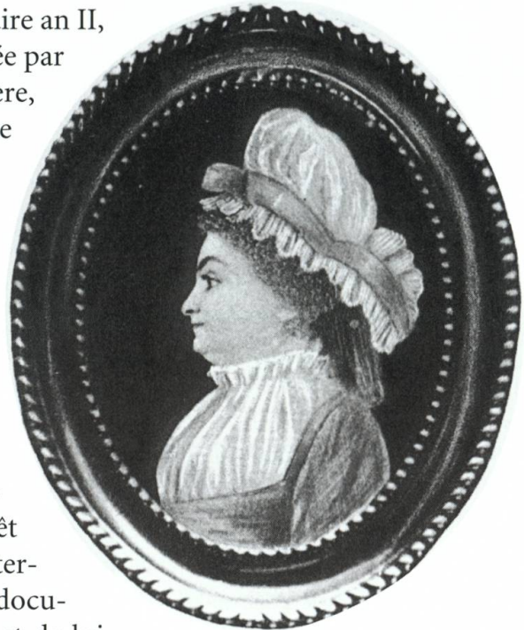
Portrait de Marie-Thérèse de Beaumarchais, d'après une miniature du XVIIIe siècle, publiée par Louis Bonneville de Marsangy, Paris, 1890.

En avril 1794, Paris devenant trop dangereux, Thérèse et sa fille quittent leur petit appartement situé rue de Paradis dans le faubourg Poissonnière suite au séquestre apposé sur