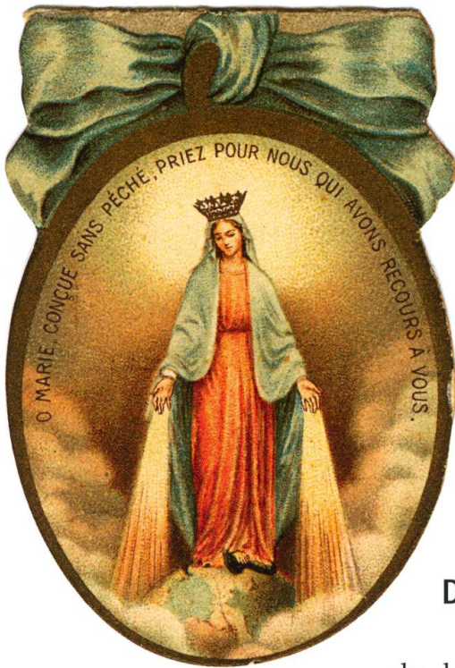
Image de la Vierge, pour livre de messe, produite à Paris et utilisée dans le canton de Fribourg, fin XIX e – début XX e siècle. MG-22250-01