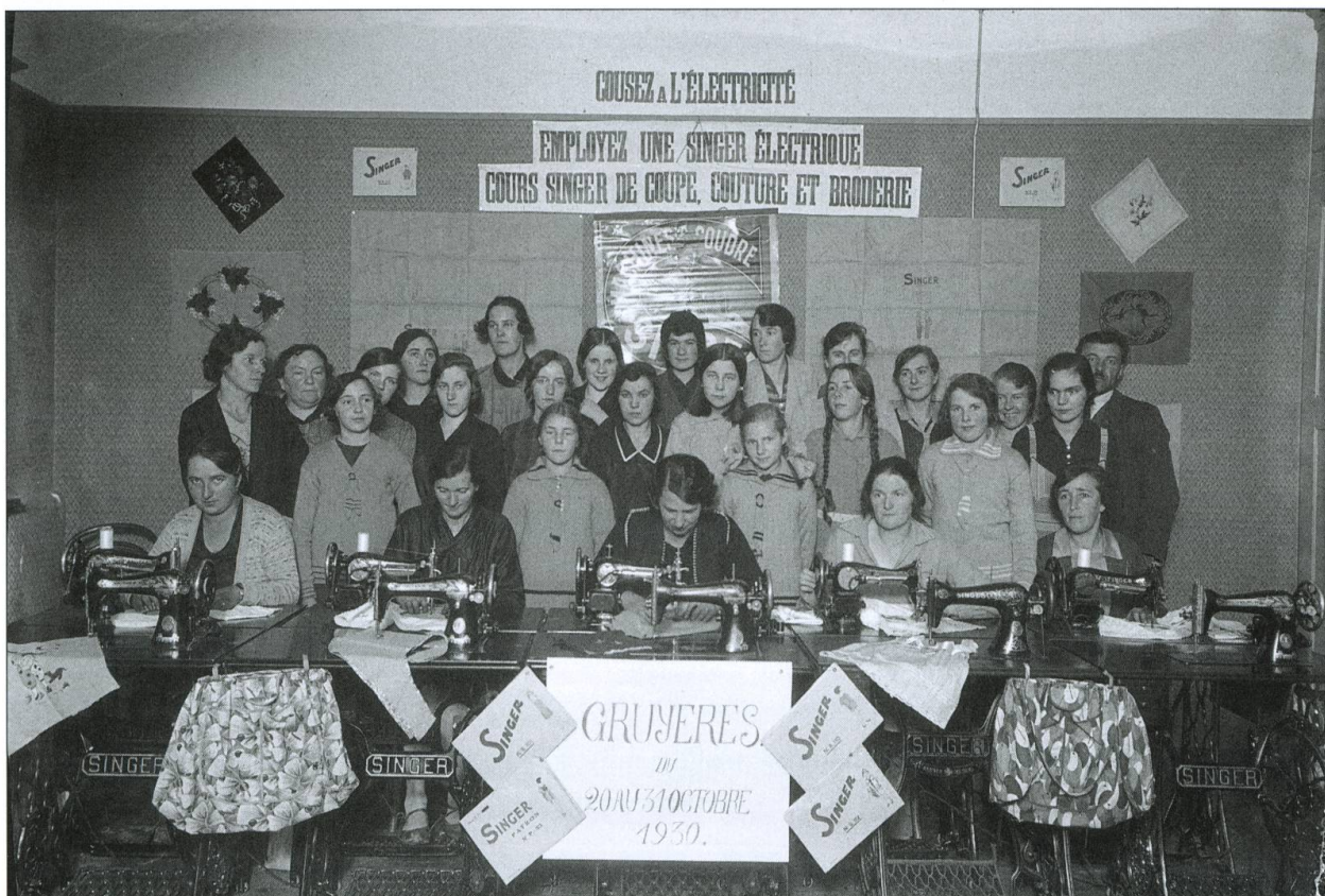
Cours de lingerie et de broderie organisé à Gruyères du 20 octobre au 31 octobre 1930 par la marque de machines à coudre Singer.