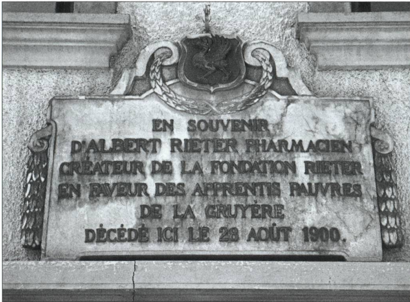
Plaque commémorative sur les immeubles de la Grand-Rue 35 et 37, Bulle.

de la commission de la fondation, présidée par le préfet et composée de l'inspecteur scolaire et des représentants des cercles de Justice de paix. 6 Ainsi, en 1924, il est rappelé «qu'il doit exister un rapport équitable entre l'élément masculin et l'élément féminin» 7 .