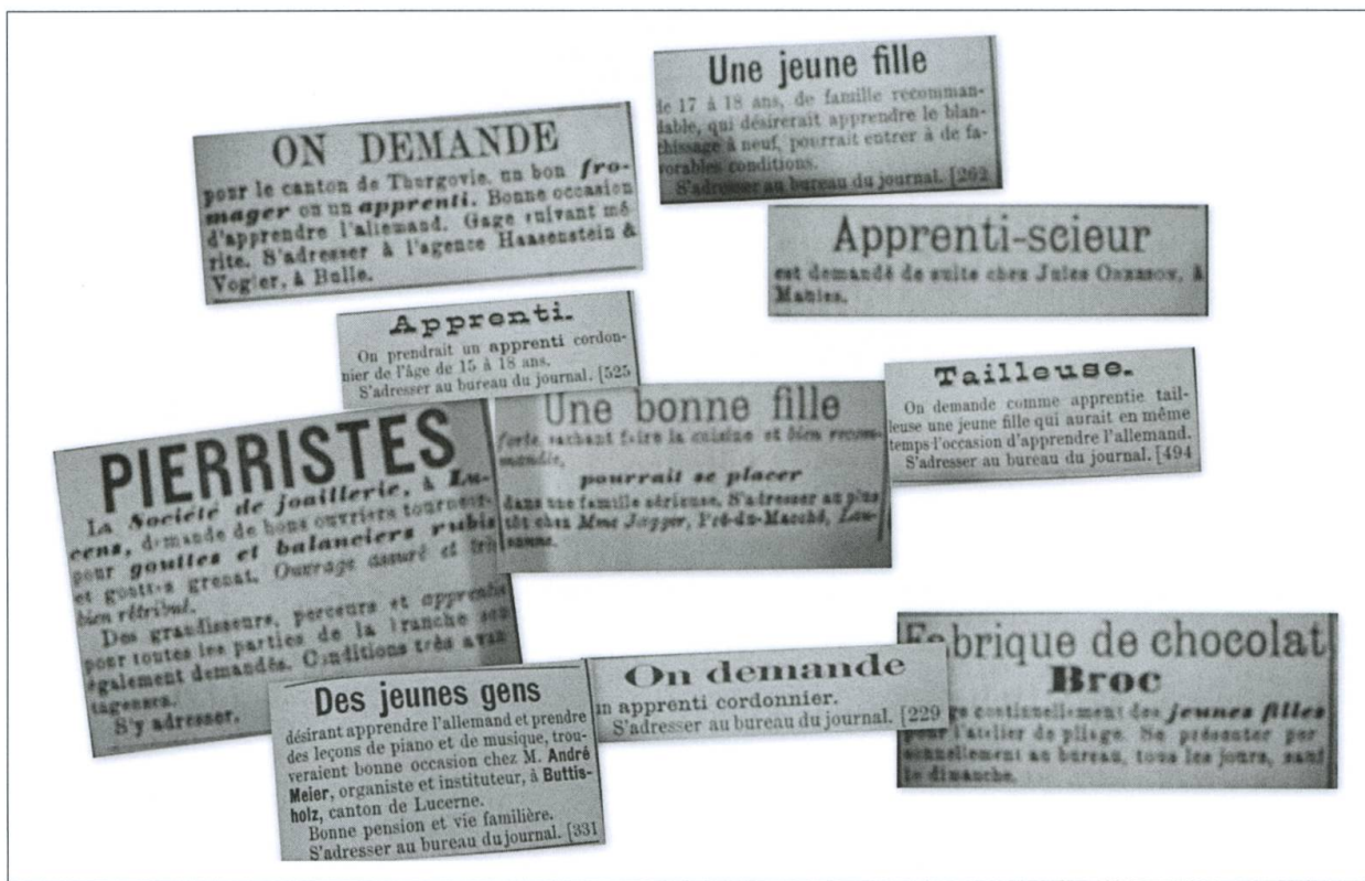
Annonces parues dans le journal La Gruyère en 1898-1899.