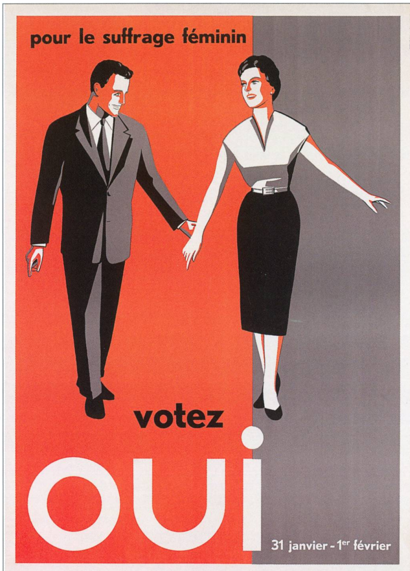
Affiche en faveur du suffrage féminin, campagne de 1959.