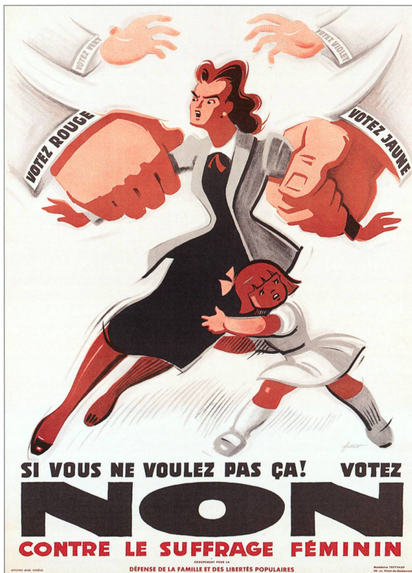
Affiche du Groupement pour la défense de la famille et des libertés populaires, 1946.