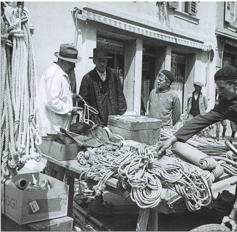
Marché à Bulle, 14 mai 1936, G-10-15-0227-11

Par son matériau et sa forme, ce vêtement ressemble aux blouses brodées de fleurs multicolores portées par les groupes folkloriques et les joueurs de musique populaire en Suisse alémanique. Sa forme, tout comme la couleur bleue du tissu de coton ordinaire, est répandue dans beaucoup de campagnes françaises à la même époque entre 1850 et 1940. La blouse est un article de confection qui s'achetait