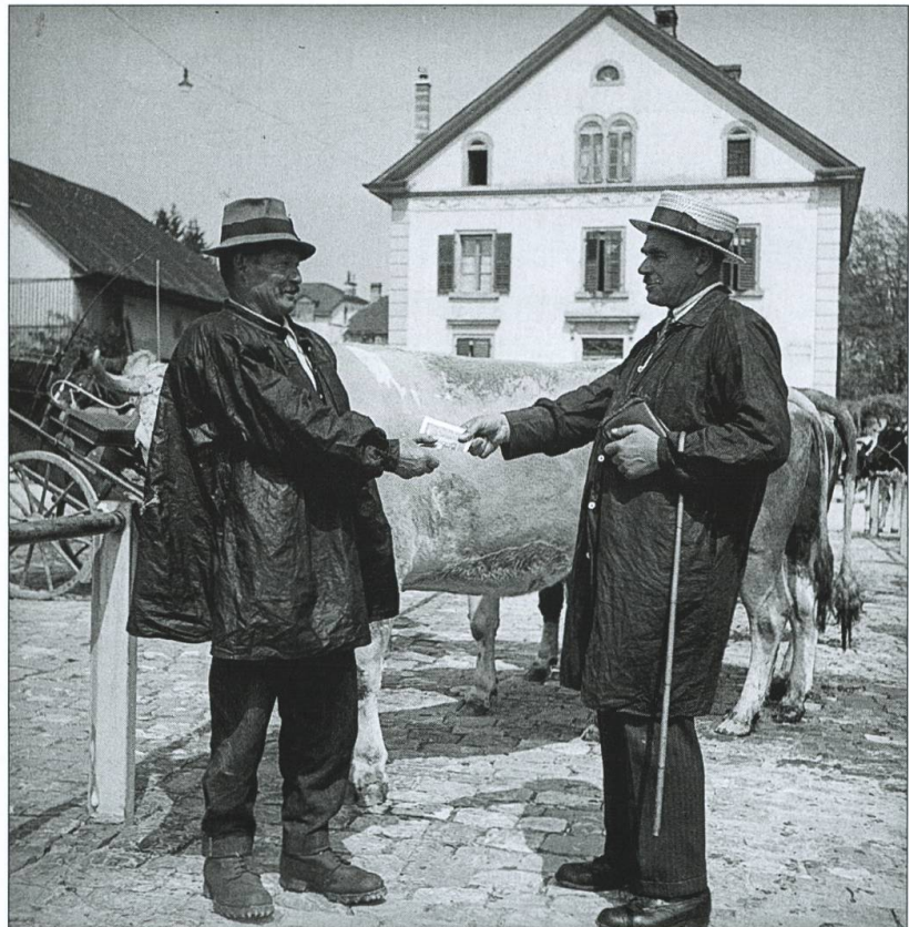
Marché à Bulle, 14 mai 1936

Par son matériau et sa forme, ce vêtement ressemble aux blouses brodées de fleurs multicolores portées par les groupes folkloriques et les joueurs de musique populaire en Suisse alémanique. Sa forme, tout comme la couleur bleue du tissu de coton ordinaire, est répandue dans beaucoup de campagnes françaises à la même époque entre 1850 et 1940. La blouse est un article de confection qui s'achetait