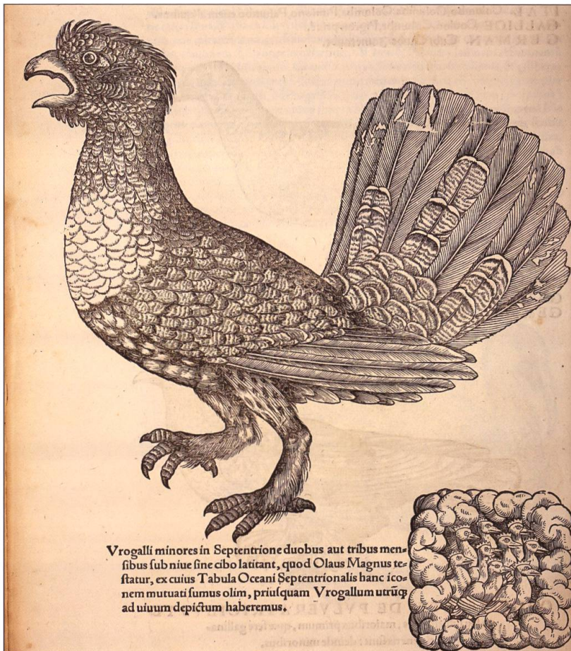
Une des premières représentations du grand tétras paraît dans l'ouvrage Icones avium omnium du Suisse Conrad Gessner en 1555.

Il est bien clair que le grand tétras n'a pas attendu les premières descriptions zoologiques pour apparaître dans la région. Il était sûrement connu de longue date