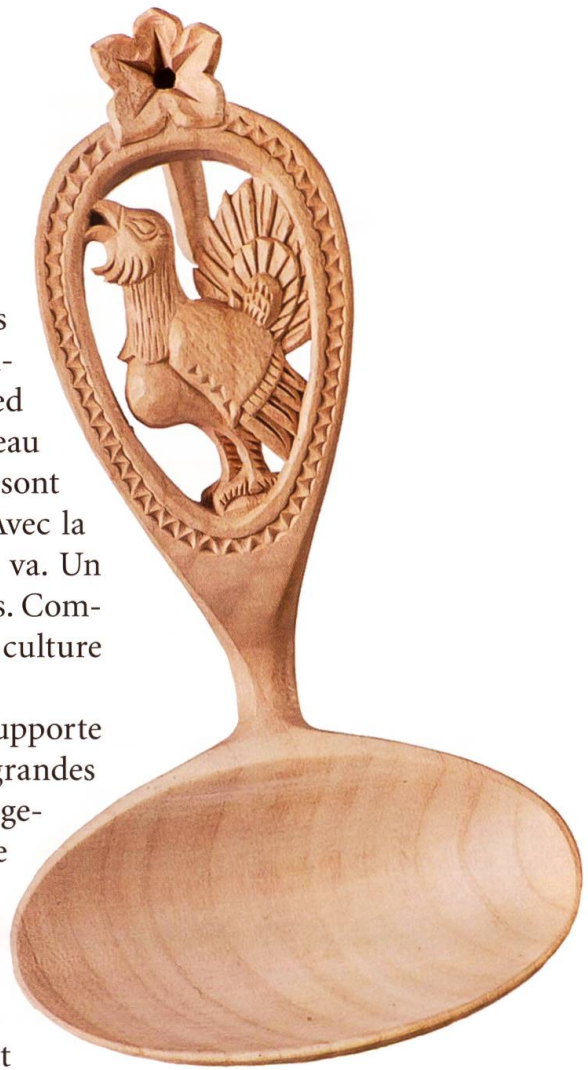
Cuillère sculptée par Robert Blanc, 1975. Musée gruérien. IG-5909

Le grand tétras est un oiseau exigeant qui supporte peu de demi-mesures. Très spécialisé, il a besoin de grandes forêts sauvages en mosaïque, libres de tout dérangement. Est-on encore capable de lui offrir une petite chance? Le grand tétras questionne notre rapport à la nature. La pression humaine s'accroît partout et les défis augmentent pour conserver les espèces exigeantes liées à des milieux particuliers. Mais tout espoir n'est pas perdu et les mesures ne sont pas vaines pour autant; le grand tétras est une espèce «parapluie» qui sert d'emblème aux forêts de montagne. Ces milieux abritent bien d'autres espèces sensibles qui devraient profiter de cette prise de conscience. Parmi elles, la bécasse des bois dont les effectifs nicheurs ont fortement chuté en Suisse et qui continue d'être chassée.