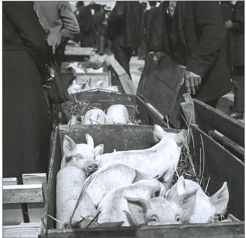
Marché de Bulle, 14.5.1936

physique et chimie élémentaires, botanique, zoologie, anatomie et physiologie, pathologie et thérapeutique, pharmacologie et matière médicale vétérinaire, hygiène et médecine légale, amélioration des races, et police de santé 16 .