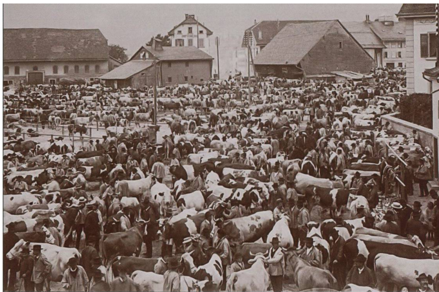
Bulle, Foire de la Saint-Denis, 1907

est violente, on peut saigner les animaux jeunes et robustes. Pour boisson de l'eau fraîche, qui doit toujours être à la portée de l'animal. On peut l'aciduler avec un peu d'acide muriatique. On humecte les vessies et les ulcères d'abord avec de l'eau tiède ou une décoction émolliente qu'on peut remplacer par des graisses et de l'huile très-douces 8 .»