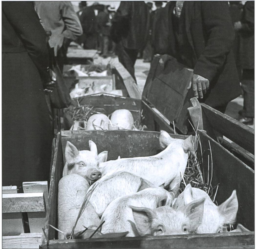
Marché de Bulle, 14.5.1936

physique et chimie élémentaires, botanique, zoologie, anatomie et physiologie, pathologie et thérapeutique, pharmacologie et matière médicale vétérinaire, hygiène et médecine légale, amélioration des races, et police de santé 16 .