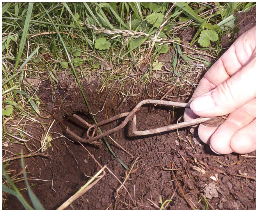
Une trappe tendue prête à la pose dans la galerie