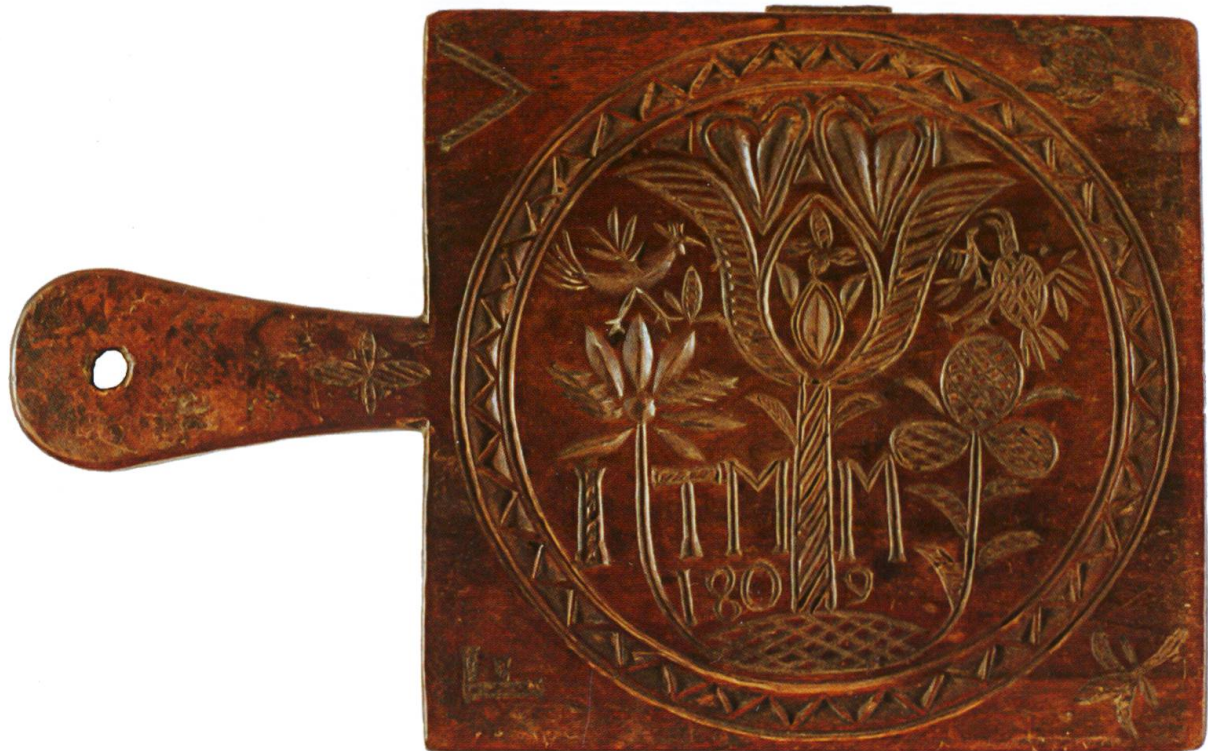
Moule à beurre datant de 1809, Musée gruérien JG-1168

la dispense pour la viande le mercredi et pour les œufs le vendredi. Mais cette générosité cache une demande: tous ceux qui jouissent de cette dispense doivent contribuer à la construction de la collégiale de Berne 8 .