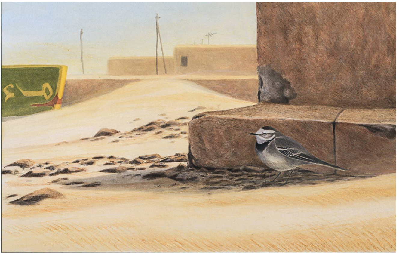
Jérôme Gremaud, Bergeronnette grise, Sahara occidental, décembre 2005.

frontières du canton, trouve sa voie dans une touche extrêmement réaliste. Avec un pinceau très maîtrisé, elle rend chaque poil d'une toison et les détails expressifs d'un œil ou d'une corne. Elle répond ainsi à une clientèle qui entretient une relation plus émotionnelle avec des animaux, proches, affectueux et dont le regard est expressif. Chaque animal représenté reste, pour les artistes, un être vivant unique qu'il faut d'abord respecter pour ce qu'il est.