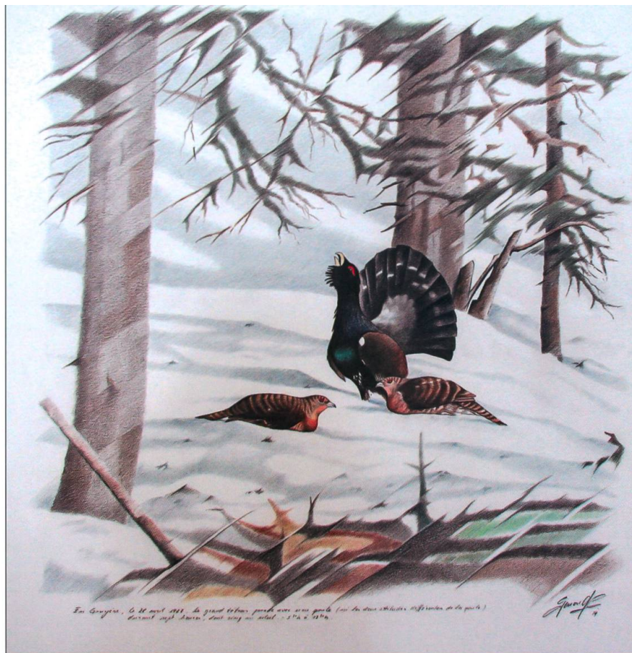
Claude Genoud, Grand tétras, coq et poules . 2015, dessin d'après les observations du 28 avril 1987 en Gruyère. Reproduction Claude Genoud.