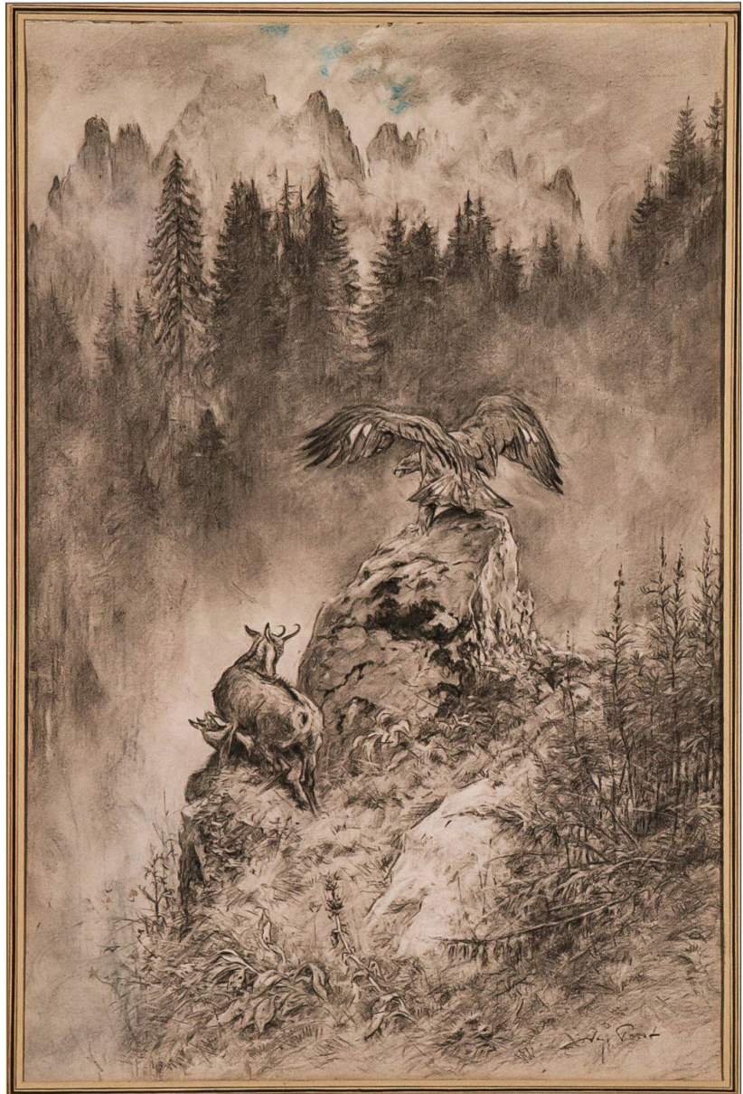
Xavier de Poret, Aigle et chamois , fusain et crayon bleu, 83/63 cm, Musée gruérien T-931

Pour s'épanouir, la vocation attend encore la rencontre décisive avec un peintre reconnu qui encourage, conseille et oriente le créateur en devenir. Les Gruériens se réfèrent à deux de leurs prédécesseurs au grand talent mais aux approches fondamentalement différentes. Le dessin du premier, le comte Xavier de Poret (1894-1975), émerveille par sa technique extrêmement précise. L'ouvrage qu'il a illustré avec la faune de la région séduit encore. Le Musée gruérien l'expose en 1994 et fait l'acquisition de plusieurs œuvres.