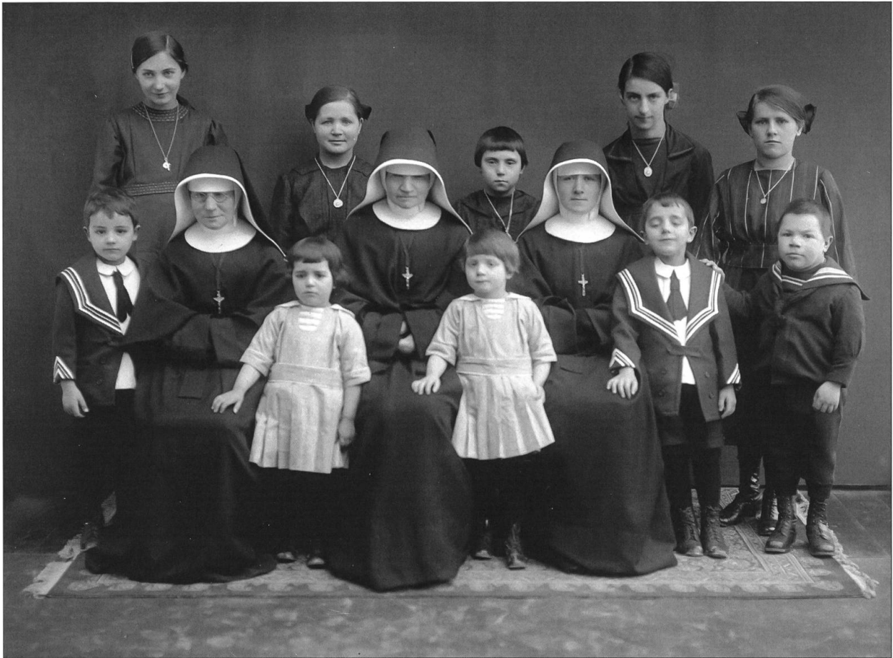
Les enfants de l'Hospice, endimanchés, avec des sœurs de la Congrégation de la Sainte-Croix d'Ingenbohl, en 1921.