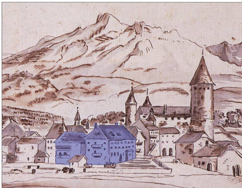
L'Hôpital construit en 1776-1777. Il est aujourd'hui le N° 3 de l'avenue de la Gare. À gauche, le rural.