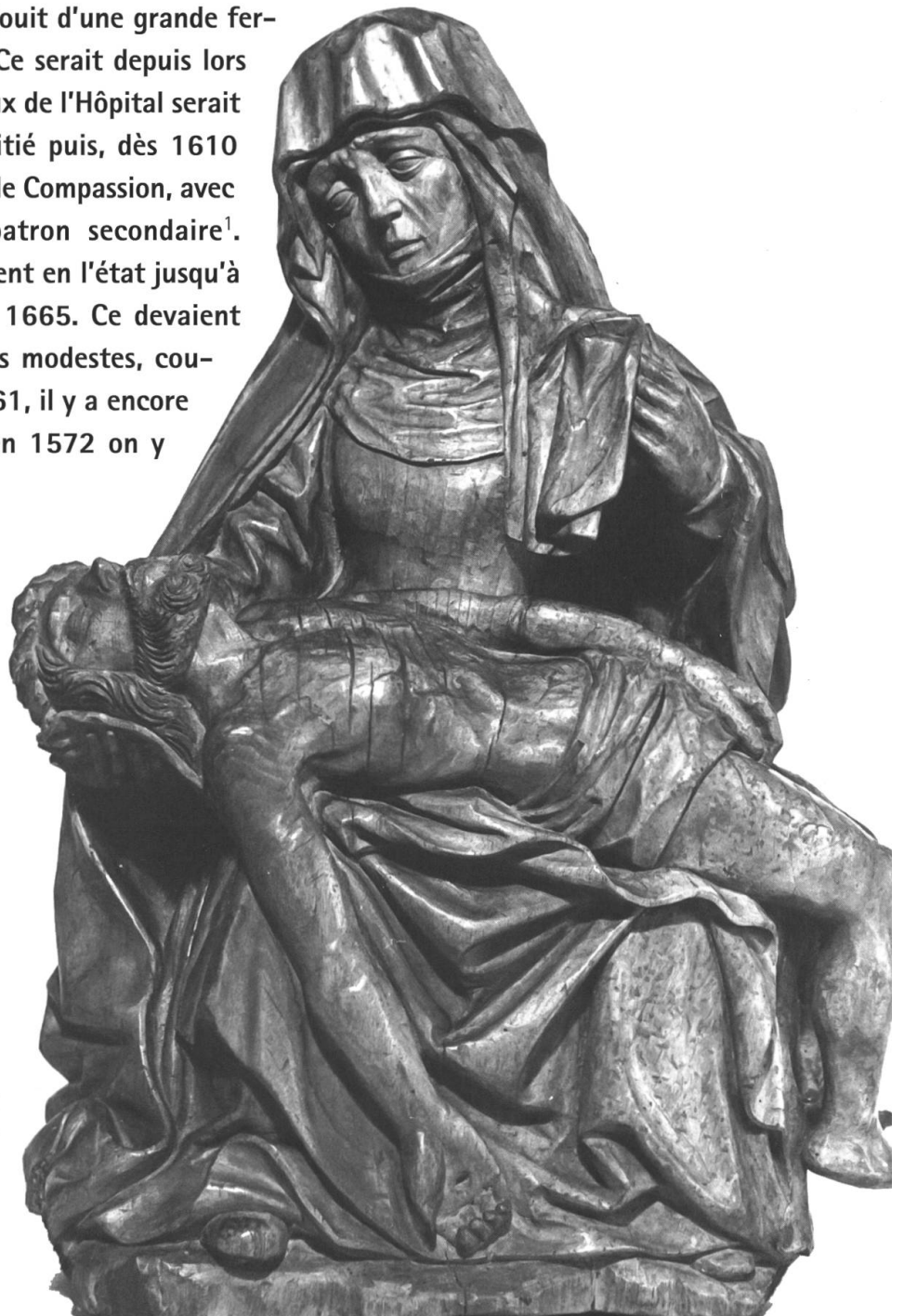
La plus ancienne représentation d'une piété, du XV e siècle, provenant de la chapelle N.-D.-de-Compassion. Musée gruérien NDC-002