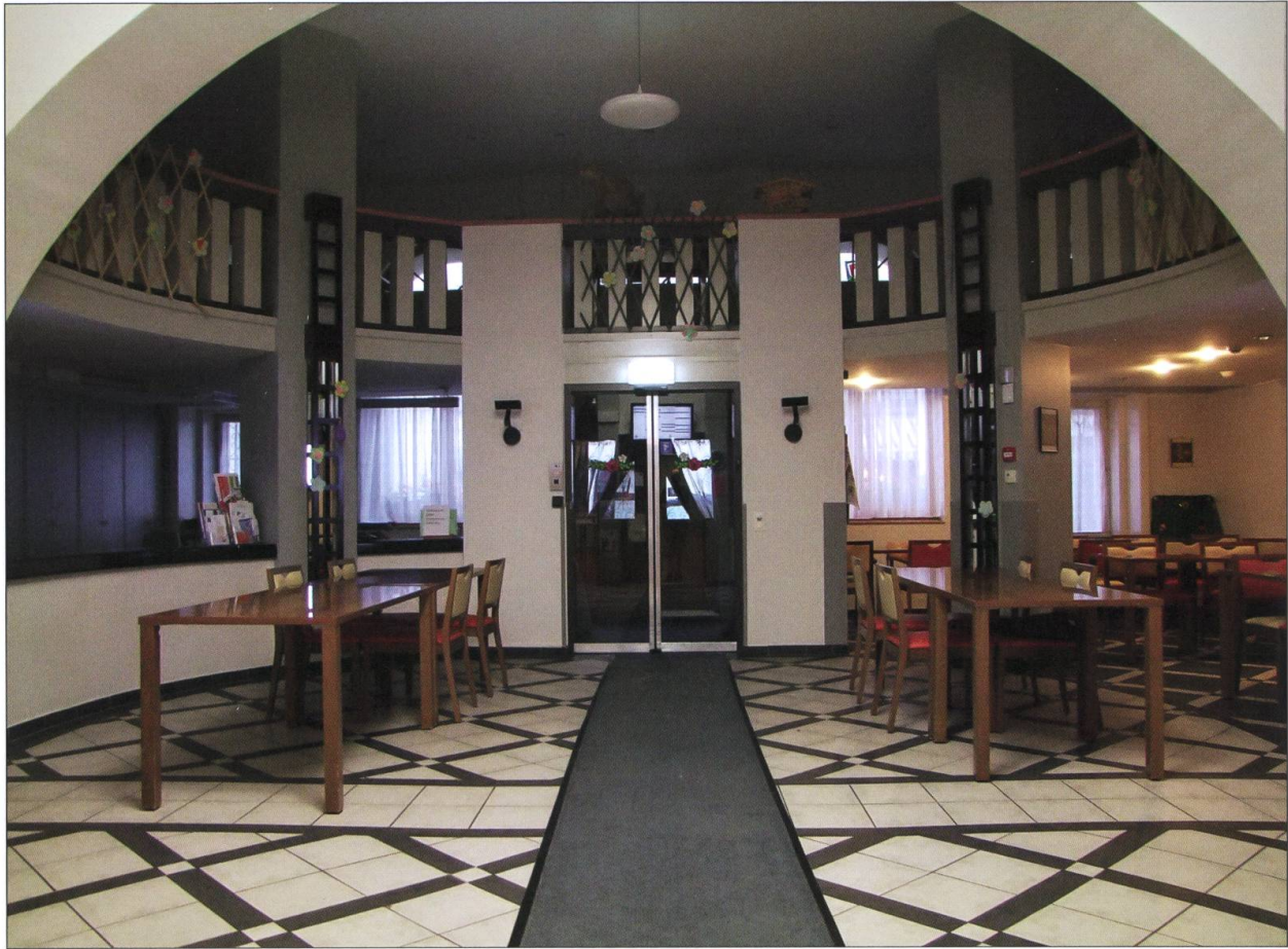
Le hall d'entrée et cafétéria de la Maison bourgeoiale, où se tenait le marché au beurre et aux œufs de 1832 à 1902. État juillet 2019.

En 2019, avec un personnel de 42 EPT (équivalents plein-temps), dont 35 pour les soins, au service de 47 pensionnaires, la Maison bourgeoiale de Bulle s'inscrit dans l'histoire d'une institution qui remonte, sans interruption, à 1348. Le « charitable et pitoyable Hôpital » est devenu un Hospice, puis un établissement médico-social dont les résidents bénéficient de l'attention d'un personnel compétent, dans un cadre chaleureux.