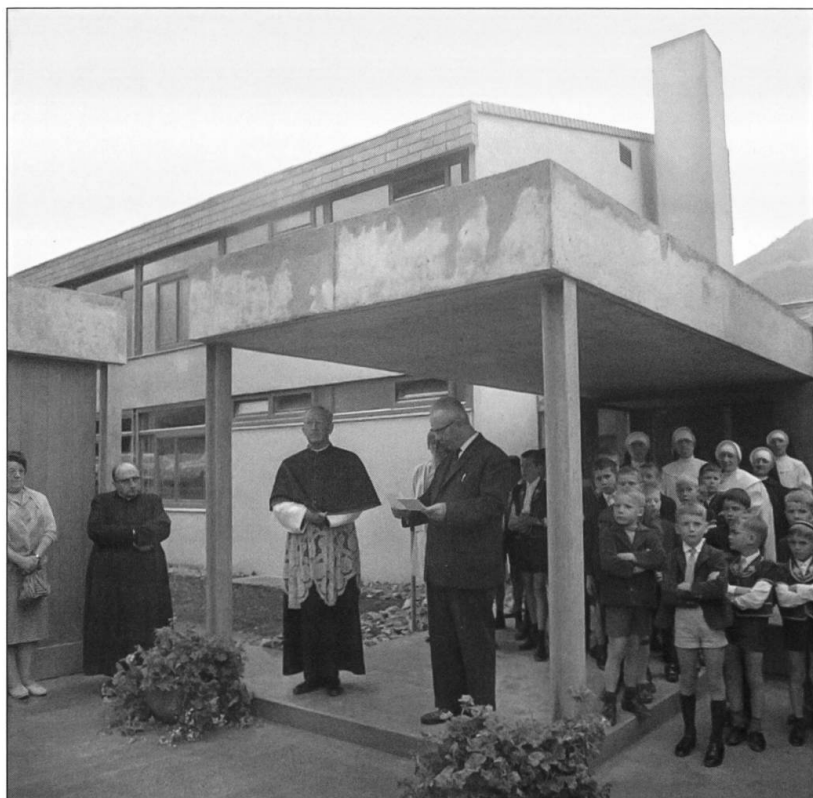
Inauguration du Préventorium des Sciernes d'Albeuve, juillet 1966