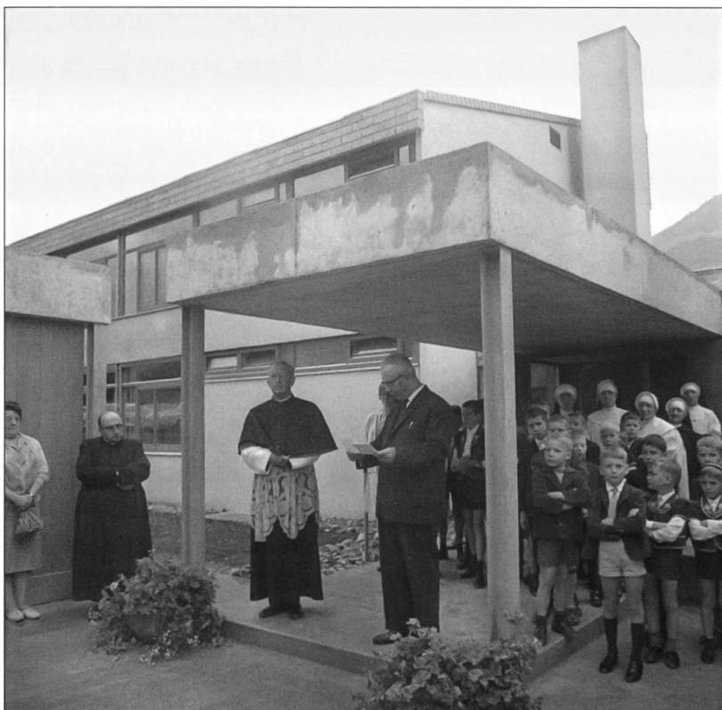
Inauguration du Préventorium des Sciernes d'Albeuve, juillet 1966