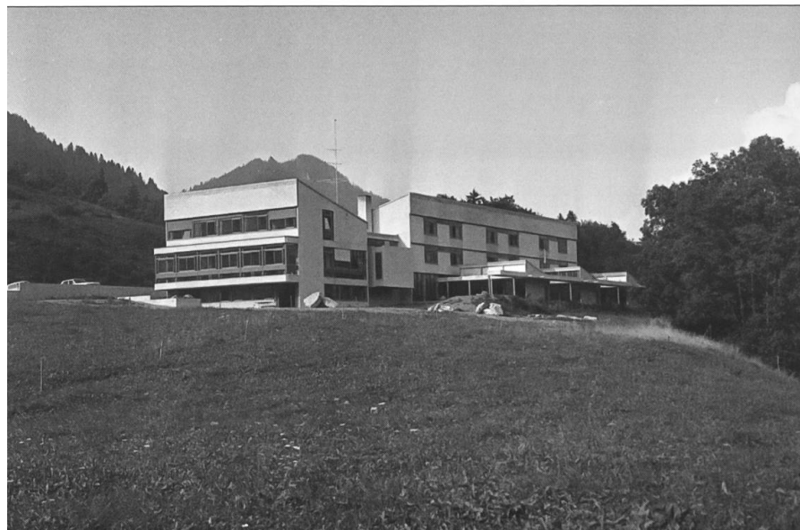
Inauguration du Préventorium des Sciernes d'Albeuve, juillet 1966