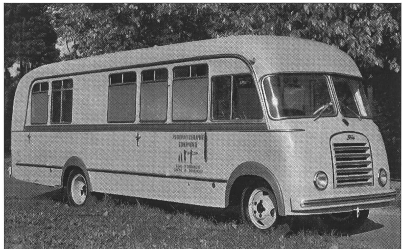
Camion radiophotographique de la Ligue fribourgeoise contre la tuberculose.

D'autre part, la notion extrêmement large de « menacé de tuberculose » permettait d'accueillir des enfants convalescents ou jugés faibles et fragiles. La Ligue fribourgeoise a donc plaidé pour 50 lits et une annexe au bâtiment exploité par les sœurs, ce qui permettait un droit de regard sur le fonctionnement de l'établissement.