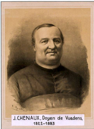
Joseph Reichlen: Portrait de Jean-Joseph Chenaux, Rd Doyen de Vuadens. La Gruyère illustrée , 1891, planche XI.

prise de l'avocat Jean-Pierre Python qui avait traduit Virgile en patois. Pour l'abbé Dey en effet, « écrire en patois, vers ou prose, c'est perdre son temps ».