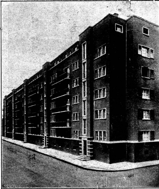
Vue de l'angle rue Simon-Durand et rue des Allobroges.

Clichés et texte de la Revue « BATIR » organe de l'A.D.E.A