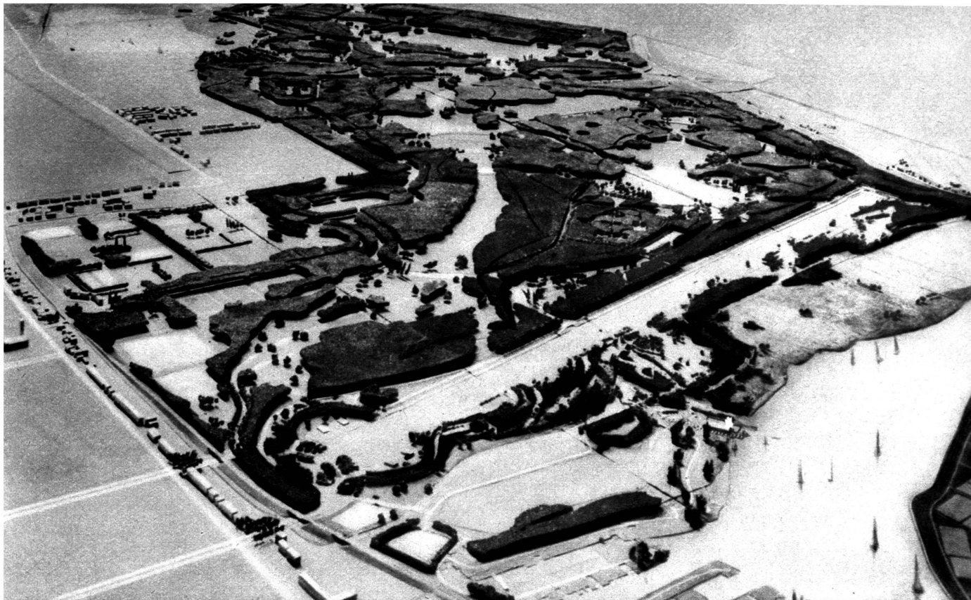
Vue générale, en maquette, du « Bois » projeté à Amsterdam.