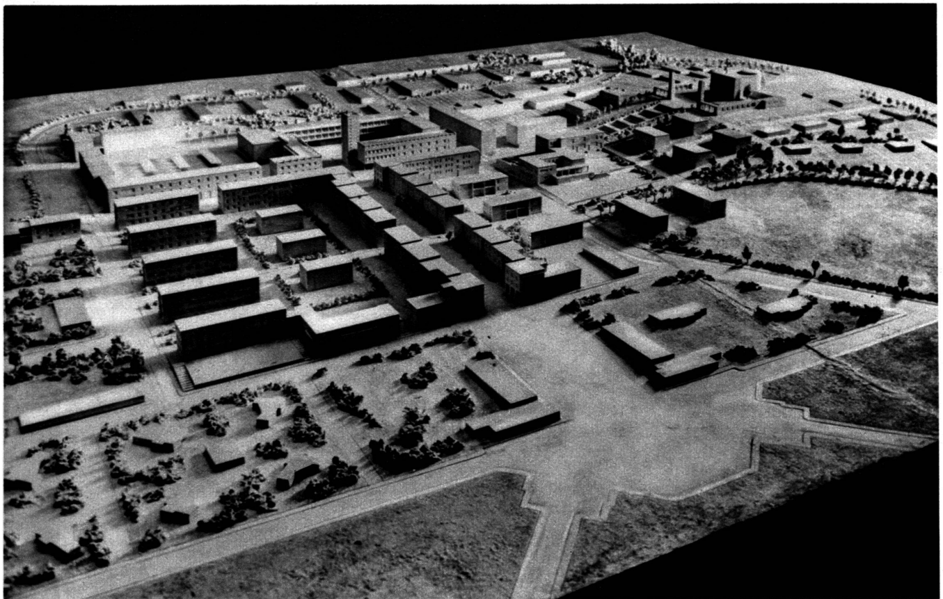
Guidonia : la ville de l'aviation.