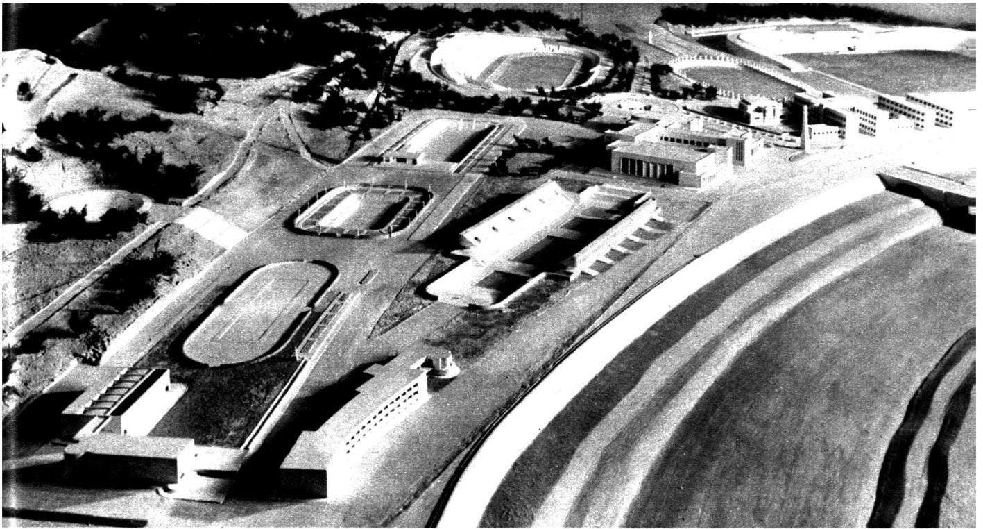
Le Forum Mussolini, à Rome.

Cependant, un examen plus attentif permet de constater que, dans ce domaine, un temps d'évolution est nécessaire. Il semble qu'en Italie on veuille tout ou rien. Si, d'une part, la nation a trouvé l'expression plastique de son caractère dans la construction et le renouvellement des villes, cet effort est nécessairement limité à un certain nombre de cités. Que deviennent les autres avant de recevoir le plan directeur et d'aménagement approuvé par le gouvernement? Des mesures intermédiaires telles que le « zoning » seraient à même de prévenir les erreurs inévitables avant l'établissement d'un plan définitif.