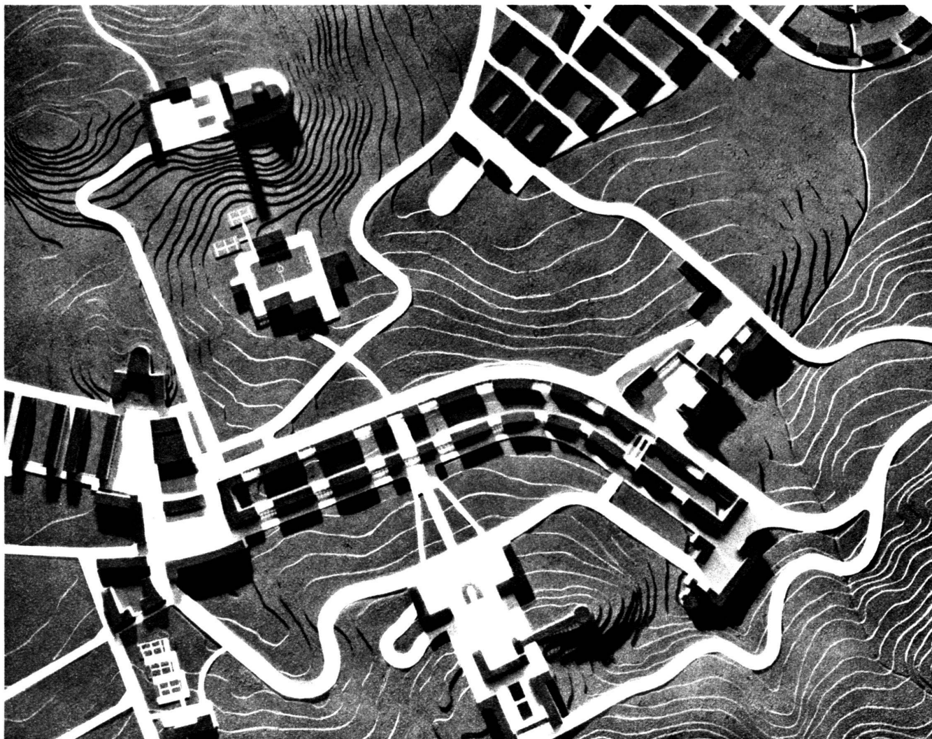
Les nouvelles villes coloniales : Projet pour le centre de Gondar.

Ceux qui ont pu suivre le développement de l'urbanisme italien ont constaté que, des mesures rudimentaires d'il y a une vingtaine d'années, il a passé durant cette dernière décennie à des conceptions audacieuses qui dépassent les réalisations de pays tels que l'Allemagne et l'Angleterre, qui furent à la tête du mouvement.