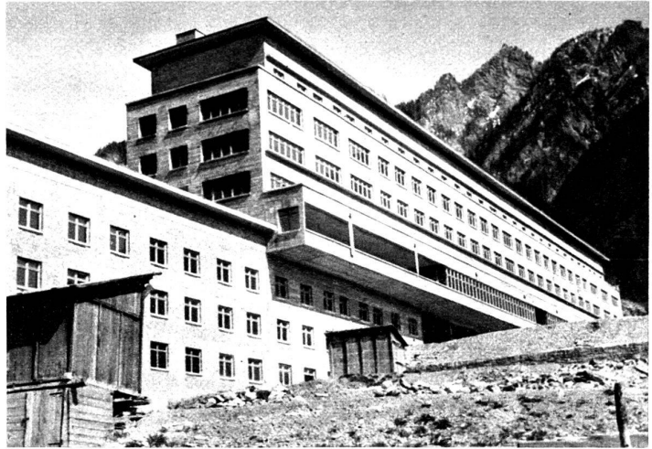
Hôpital cantonal à Coire, actuellement en construction, équipé avec la robinetterie antibruit Elysium

Tout ce qui contribue à solutionner le problème de « l'insonorisation » doit intéresser, à des titres divers : architectes, entrepreneurs, régisseurs et propriétaires.