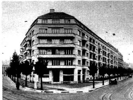
Immeuble de rapport à Zurich, équipé avec la robinetterie antibruit Elysium.

ou d'une chasse d'eau venant se greffer tout à coup sur une conversation ou perturber quelque audition radiophonique.