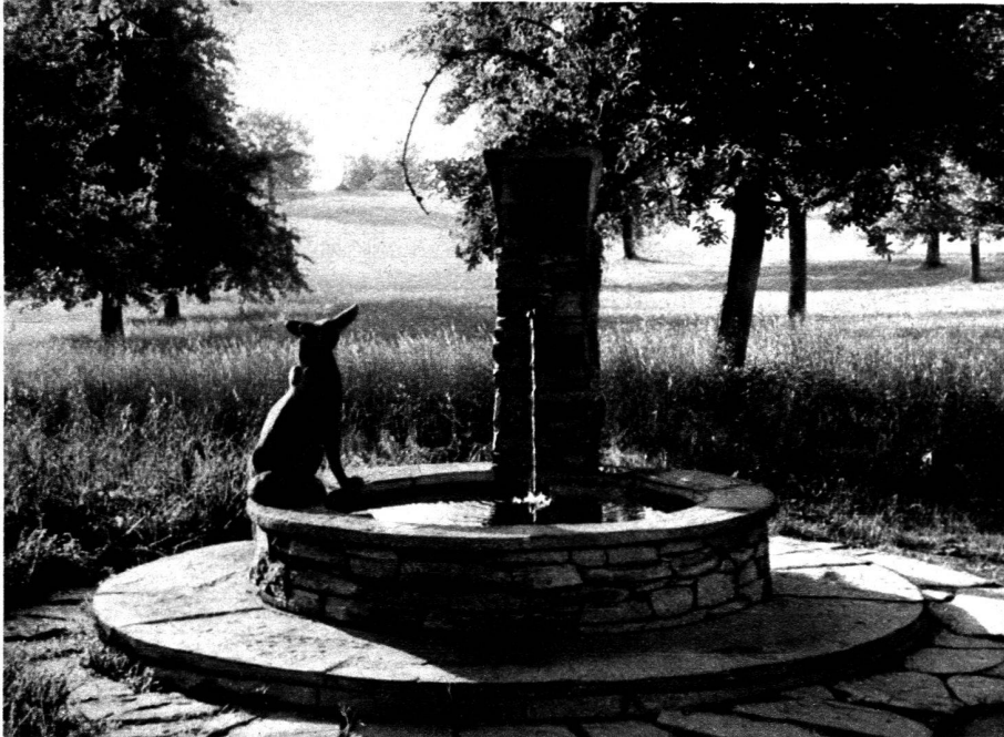
La fontaine « Le Renard et les Raisins » de l'Exposition nationale, actuellement chez M. le D r L., à Weggis (terre cuite).