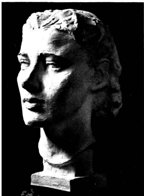
Buste de M me V. (plâtre).