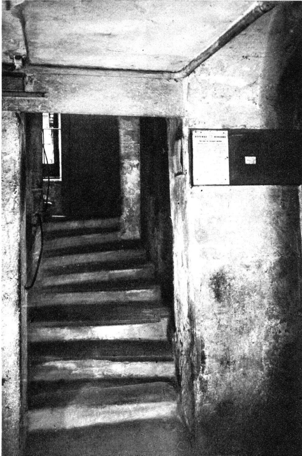
Rue de la Fontaine.