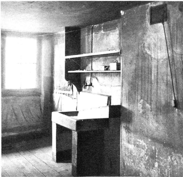
Rue des Chaudronniers.